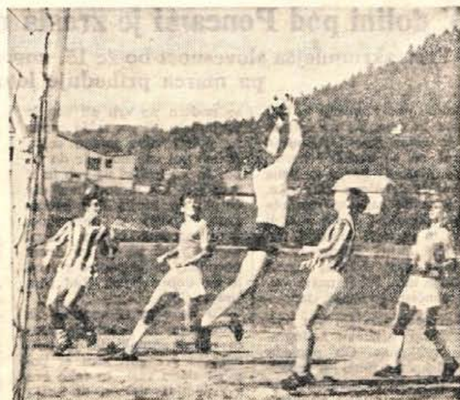
Nogometaši Kranja so uspešno startali v drugi republiški ligi in so v nedeljo doma gladko premagali ljubljanskega Slovana.

Odbojka — V republiški ligi so tokrat nastopili le igralci iz Kamnika. Srečali so se z Mariborom v mestu pod Pohorjem in izgubili gladko z 0:3.