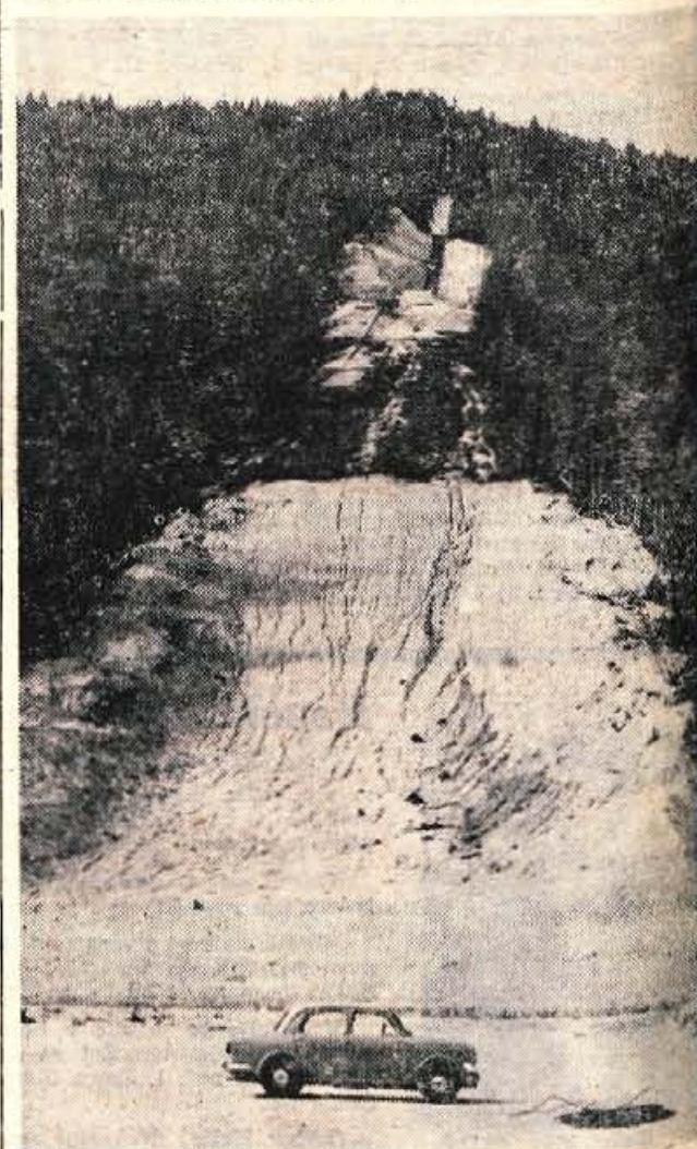
Pogled na planiško velikanko z izteka.