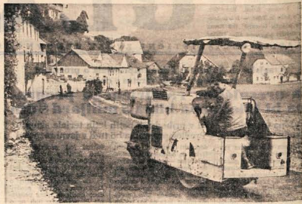
Pogled na sveže asfaltiran del ceste v Poljansko dolino. V ozadju naselje Poljane.

Vse potrebno notranjo opremo in stroje bo Termika nabavila pri firmi Jungers iz Göteborga. Švedski strokovnjaki so že dopotovali na