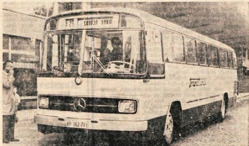
Nov, posebej za lokalne proge konstruiran avtobus, ki vozi na relaciji Škofja Loka—Kranj. Dve takšni vozili je pred 14 dnevi kupilo podjetje Transturist.