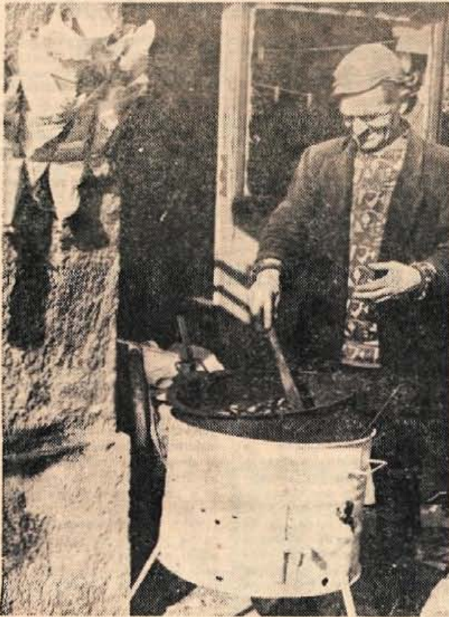
Kranjska jesenska razglednica