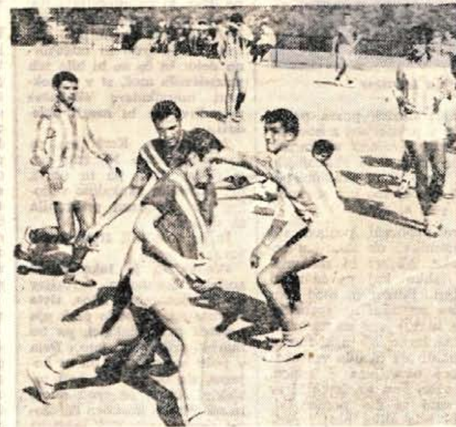
Rokometaši Kranja so v nedeljo po dolgem času spet zaigrali in premagali favorita za prvo mesto ekipo Partizana iz Št. Vida.

V dvorani doma sindikatov v Ljubljani bo v petek, 11. oktobra, 16. redna konferenca smučarske zveze Slovenije. Na tem letnem zborovanju bodo smučarski delavci ocenili delo smučarske zveze Slovenije v minulih štirih letih, od katerih je bilo po uspehih vsekakor najbolj uspešno olimpijsko leto, kjer je smučarski šport dosegel doslej najpomembnejše uspehe v zgodovini smučarskega športa v Jugoslaviji. Smučarska zveza Slovenije je v minulem razdobju posvetila največ pozornosti krepitvi osnovnih smučarskih organizacij, skrbi za dvig širokovnega kadra, mladinskih smučarskih šol ter končno seveda tudi dvig kvalitete smučanja in organizaciji večjih prireditvev.