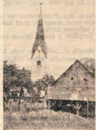
Stebenj pri Dobrli vesi na Koroškem