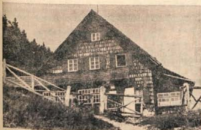
Roblekov dom vzdržuje planinsko društvo Radovljica