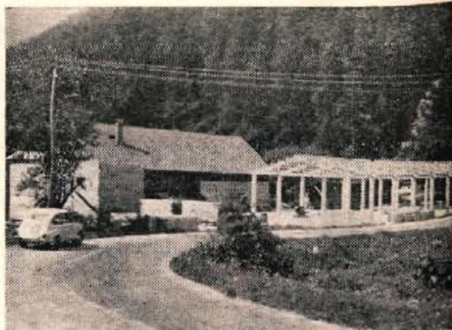
Gradnja nove strojne delavnice LIP Bled v Mojstrani