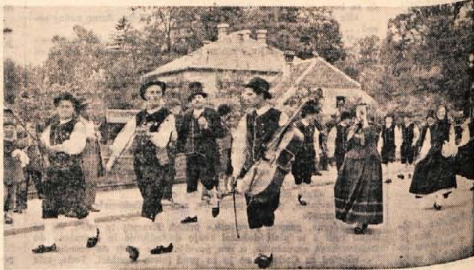
Rezijani s »citrami«