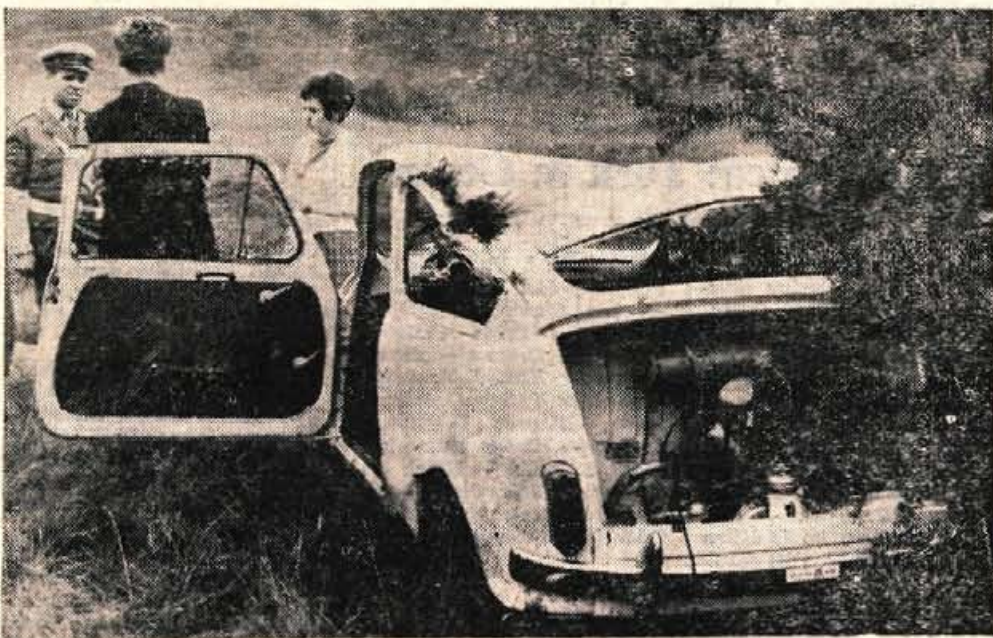
S koledarsko jesenjo, z meglo in rosenjem so se spremenili tudi pogoji vožnje na naših cestah. Spoznka cesta je botrovala tudi tej nesreči na sliki. Težje pogoje bodo morali vozniki upoštevati, da bo vožnja na naših cestah kolikor toliko varna.