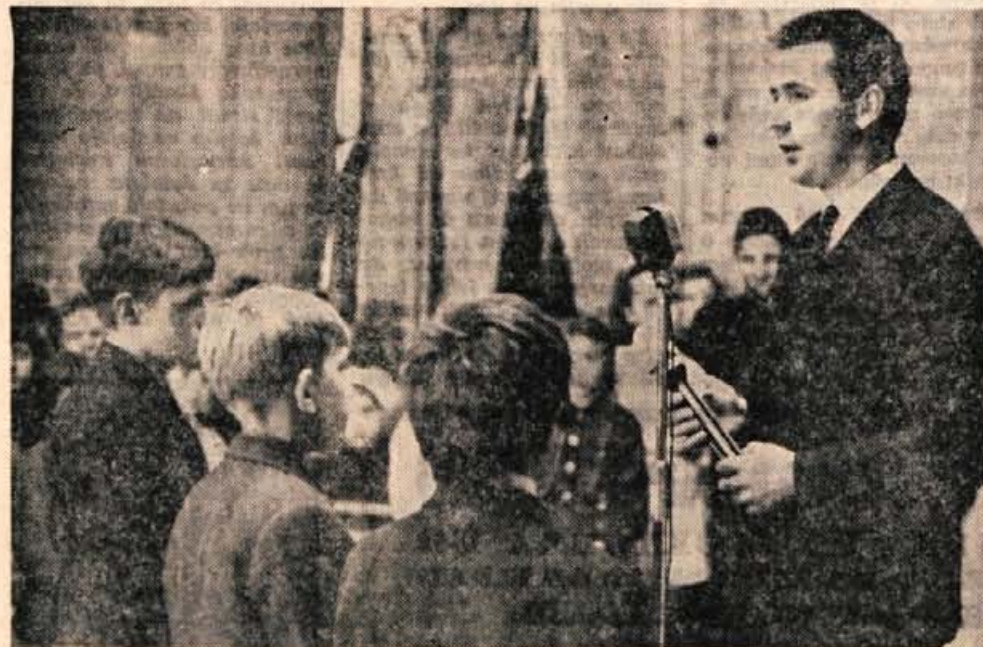
V soboto dopoldne so v Kranju kranjski planinci od šolskega planinskega odseka s Senturške gore sprejeli planinsko štafeto, ki bo ob proslavi 25. obletnice ustanovitve AVNOJ prispela v Jajce. Po krajšem postanku so jo kranjski planinci ponesli na Kokrško sedlo in naprej na Grintavec, kjer jo bodo predali kamniškim planincem.