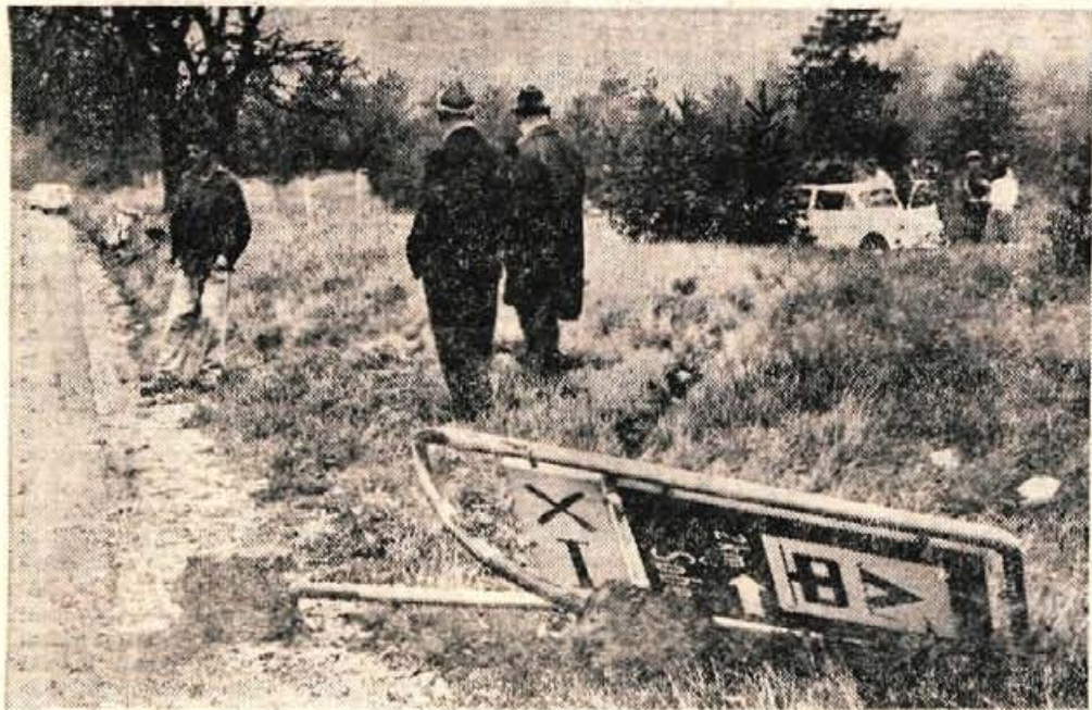
Zaradi prehitvanja na spolzki cesti je začelo zanašati osebni avtomobil na cesti drugega reda pri odcepu ceste za Sobčev bazar. Nesreča se je pripetila v nedeljo ob 12.30, avtomobil pa je vozil Jože Klančnik. Fičo je treščil v reklamno tablo, vendar na srečo ni bil nihče ranjen. Škode na avtomobilu je za okoli 8.400 N din.