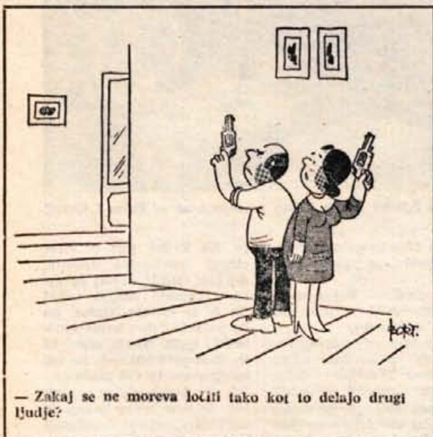
— Zakaj se ne moreva ločiti tako kot to delajo drugi ljudje?

Turška vlada je sklenila zgraditi nad grobom kartažanskega vojskovodje Hanibala mavzolej. Hanibal je umrl v pregnanstvu pred 2000 leti v bližini današnjega turškega pomorskega oporišča Gelcik. Misel za gradnjo mavzoleja se jim je porodila ob obisku tuniškega predsednika Habiba Burgibe na Hanibalovem grobu.