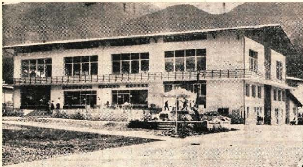
Ta del Bohinjske Bistrice je že sedaj lepo urejen. Se lepši pa bo, ko ga bodo asfaltirali. Nad moderno samopostrežno trgovino pa bo še letos podjetje Modna oblačila odprlo nov proizvodni obrat.