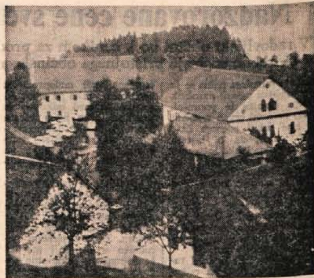
Hribovska vas Rovt.