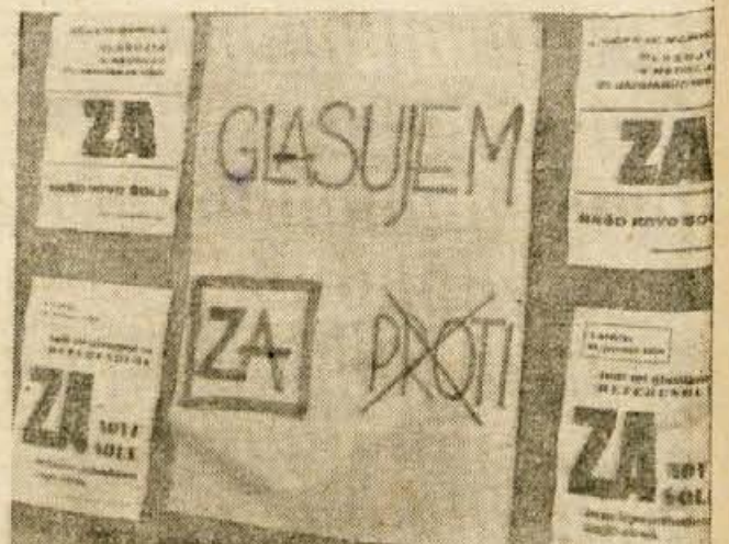
Glasujte za samoprispevek za šolstvo! Tako in drugače, povsod pa iznajdljivo, so bila v nedeljo okrašena naselja, posebno okolica volišč v radovljški občini. Posnetek je iz Bohinjske Bistrice.