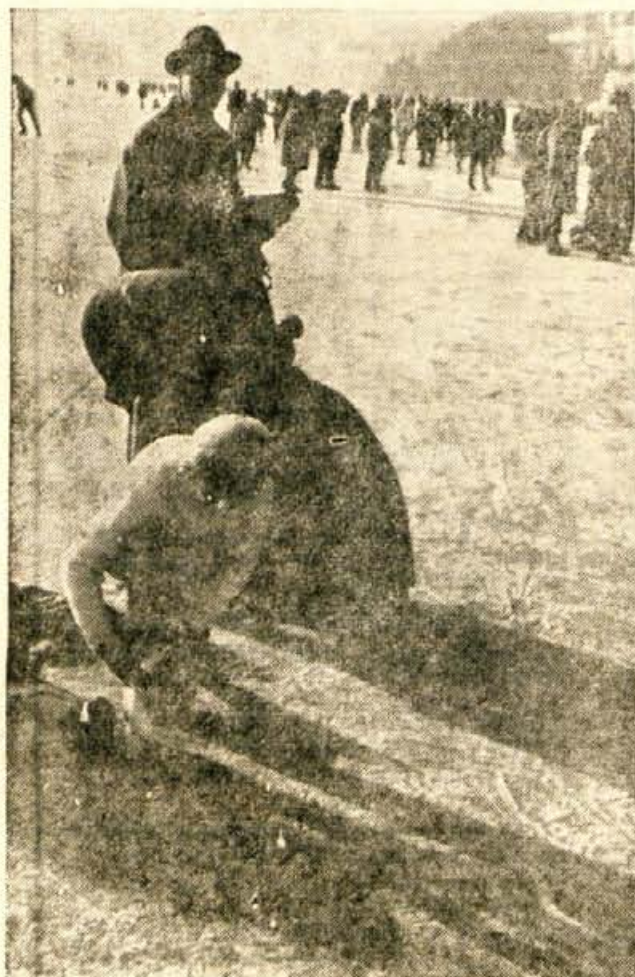
Mravljišče na ledeni ploskvi