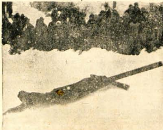
Na nedeljskih smučarskih skokih za pokal Kranja padci niso bili redki. Zaradi prekratkega izteka je tekmovanje na tej skakalnici precej nevarno.