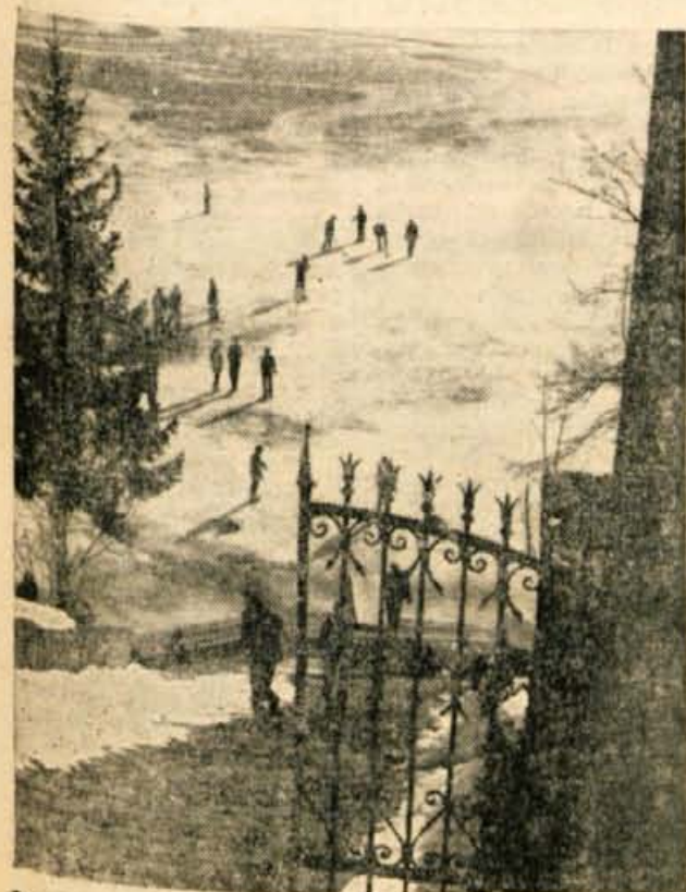
Stopnice blejskega otoka in zamrznjeno Jezero, polno drsalcev