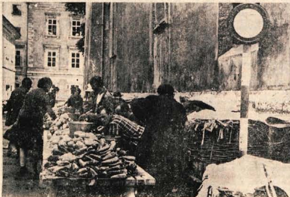
Kranj — prepovedano za ves promet, toda ne za paprike.