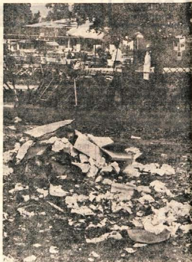
Se vam zdi, da tale kup odpadkov sodi na sicer dokaj urejen zabaviščni prostor pred razstaviščem I?

Če odštejemo kup smeti, ki noč in dan krasí zabavišče in je vsakomur lepo viden, drugega nismo našli. Končni vtis s sejma pa bi bil brez naštetih treh spodrsrlajev lahko še boljši. I. Guzelj