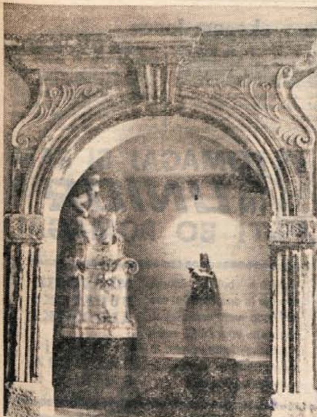
Novi galerijski prostori v II. nadstropju Mestne hiše, v katerih je prikazana umetnost od gotike do Layerja.