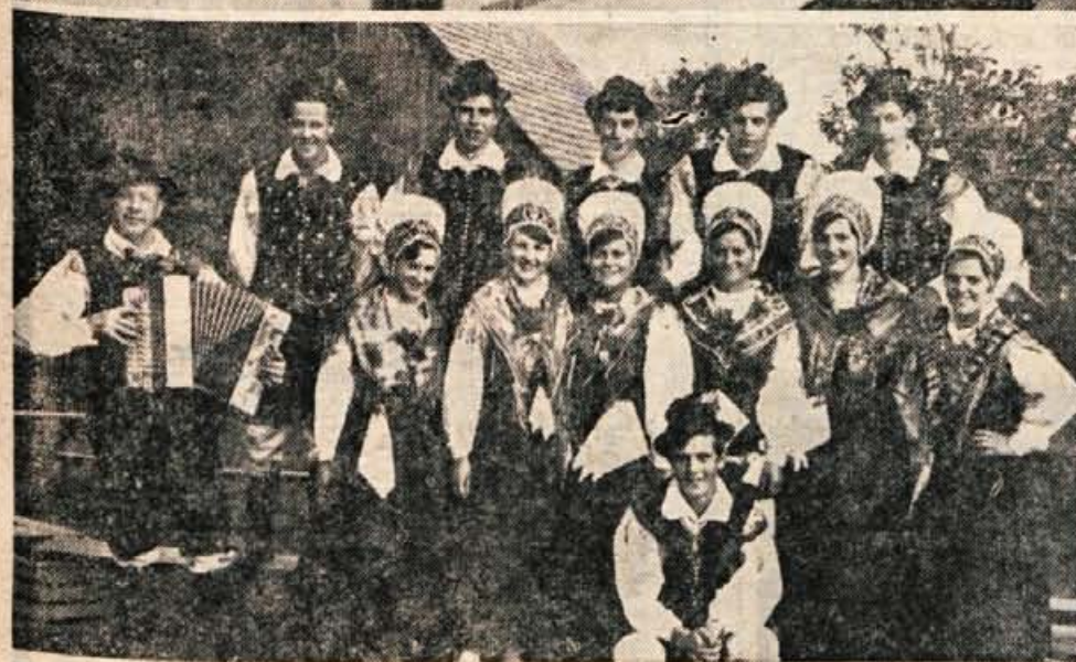
Folklorna skupina iz Besnice

Komisija za razpis delovnih mest TOVARNE ČIPK VEZENIN IN ROKAVIC BLED