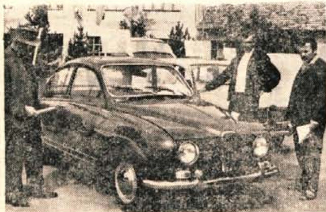
Avtomobil SAAB sedan V4 de luxe, ki jih prodaja podjetje Hermes iz Ljubljane, zbuja med obiskovalci Gorenjskega sejma veliko pozornost.