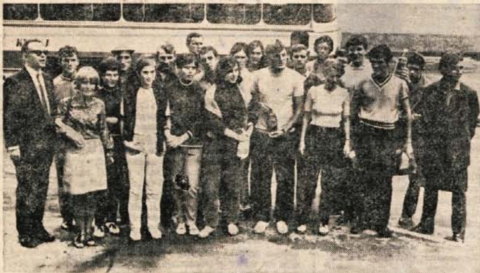
Minulo sredo popoldan je z avtobusom iz Kranja odpotovalo v pobrateno francosko mesto La Clotat 30 mladink in mladincev. S tem vračajo obisk francoskim mladincem, ki prav te dni odhajajo iz Kranja domov. Kranjčani bodo tri tedne gostje mesta La Clotat.

Pre스크bite si pravočasno rezervacije in vozne karte.