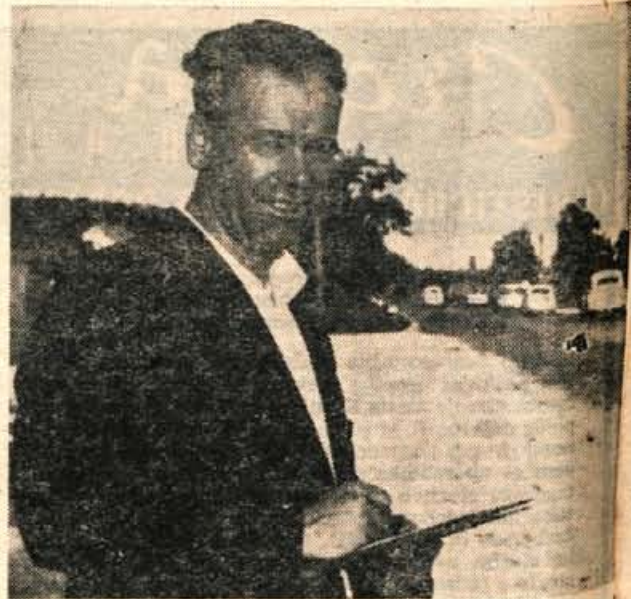
Miličnik v civilu opazuje vozila na cesti. Grešnike bo opozoril po radiu svojim kolegom.

Ne, ne, kje pa! Sele začelo se je. V službi si, bedak, si rečem. Ze so tu novi grešniki. Neki elegantni, osamljeni voznik, naše gore list, v svetlečem se prinzu je pri Podtaboru junaško prehitel avtobus. Sedaj se tega več ne spominja. Silno se razburja, pravi jezni mož je. Nazadnje vendarle izvleče tri jurje, potem pa užaljeno odpelje.