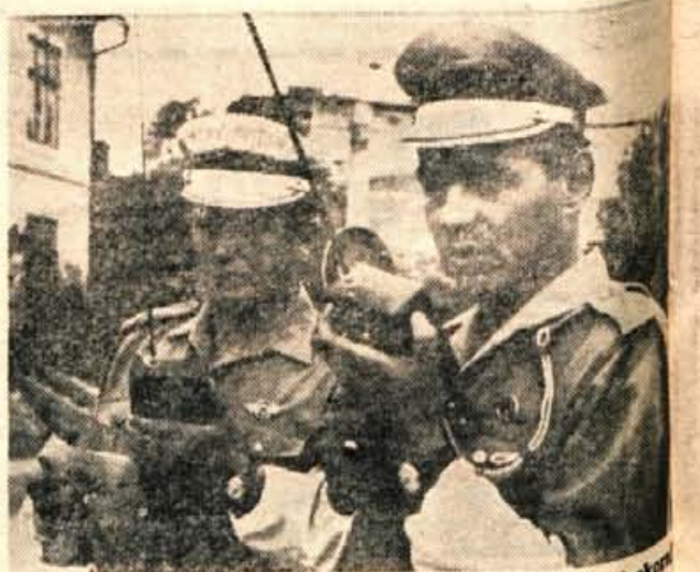
Miličniki na delu. Brez tehle naprav v rokah bi bili akcija brez moči.