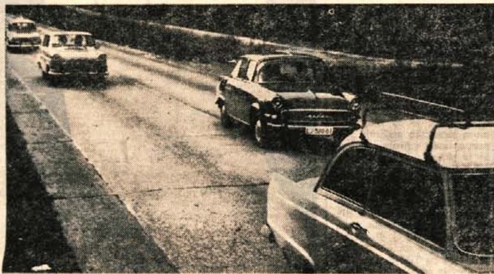
Na tem klancu je prehitevanje prepovedano. Voznik te škode očitno ne misli tako. 3000 S din ga bo veljalo tole, seveda, če srečno pripelje do Kranja.