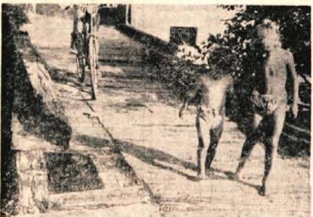
Deklici sta tokrat varno obšli luknjo v mostu. Bo tako tudi prihodnjic?