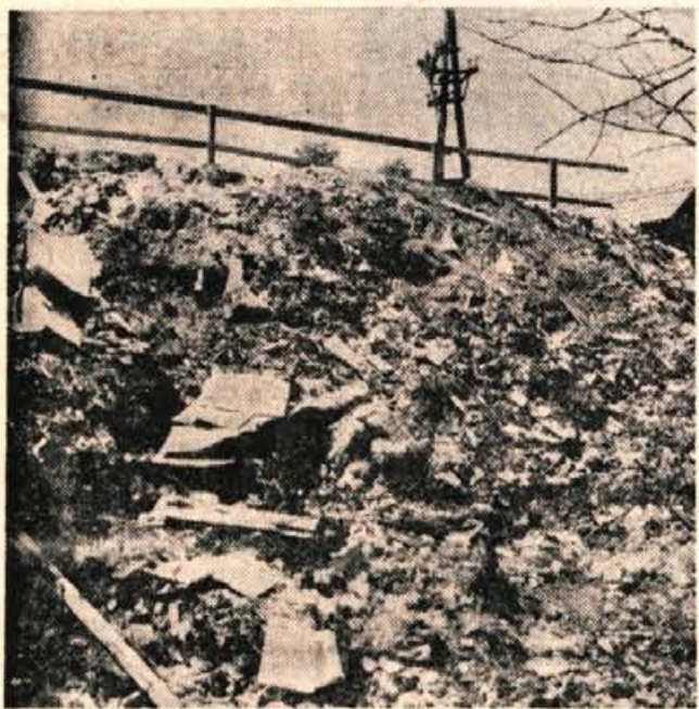
Smetišče, kakor ga vidijo kopalci ob Selščici.