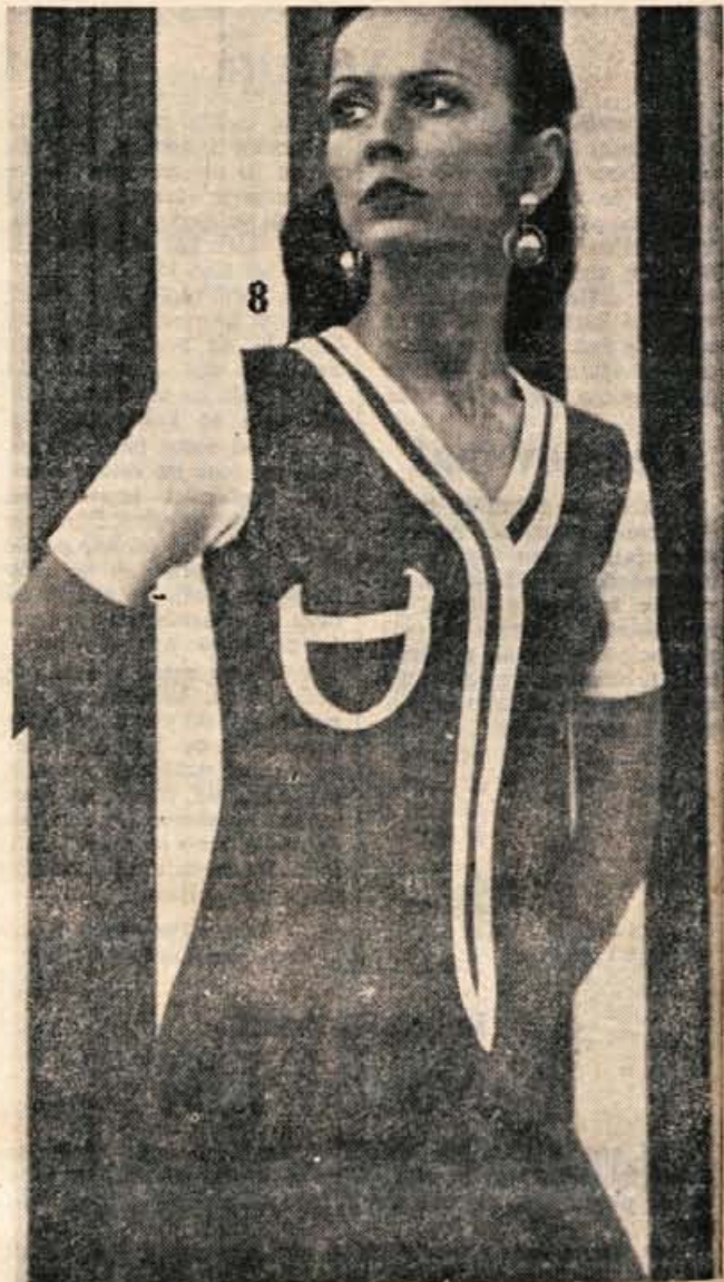
Se ena ideja za poletno obleko. Lahko jo sešijete iz platna v rdeči barvi, okrasite pa jo z dvojno črto, ki teče okoli vratu in optično zožuje postavbo. Belo je obrobljen tudi majhen žep.