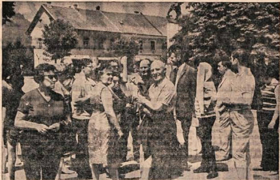
Podobno kot lani, je tudi letos prišlo v Kranj več belgijskih turistov. Zadnji dve skupini sta prišli minulo soboto in nedeljo v hotel Evropo. Med njihovim bivanjem v Kranju jim je osebje hotela Evropa pripravilo piknik, ogledali pa so si tudi nekatere kranjske kulturne, turistične in druge znamenitosti. (vig) — Foto: F. Perdan