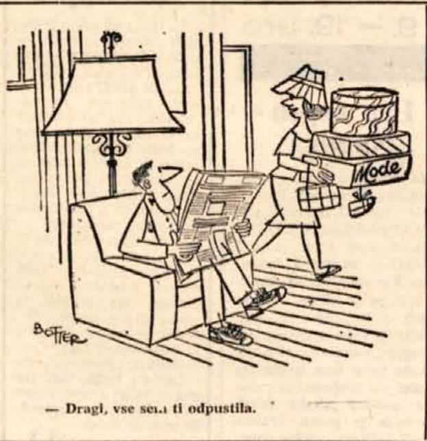
— Dragi, vse se ti odpustila.

Avstro-Ogrska... Ze od večer In Avstro-Ogrska, ki mu jo Avstro-Ogrska, ki mu kljub prazni ne pusti zaspati, čeprav bi moral polnočjo. Avstro-Ogrska, ki jo kmalu potem spremeni v čuden cesarja Karla na steni učiteljevo obraz, o katerem je učitelj trdil dobrota do avstrijskih narodov, domovine, ki bo že v najbližji bo