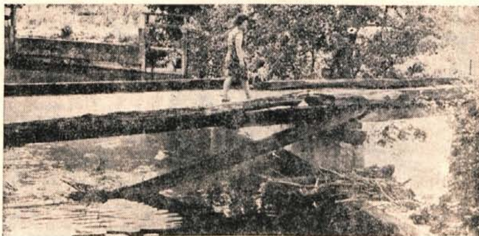
»Popravite me!« nemo kriči mož zdihljajev. Brez uspeha!