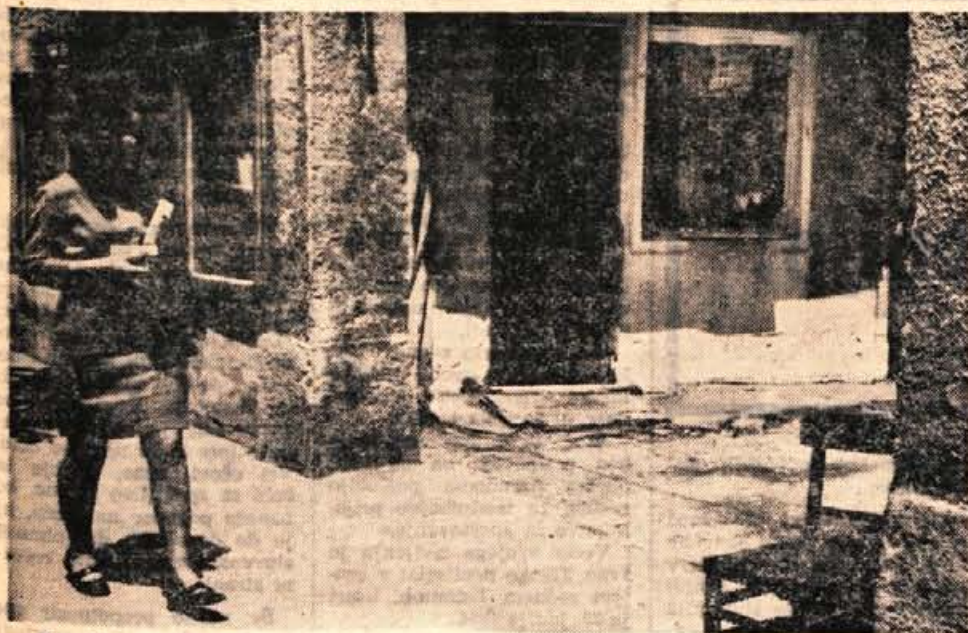
Kranjska razglednica