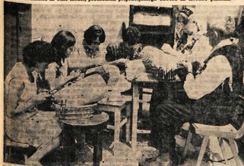
Med izseljenci na loškem gradu je skupinica čipkarič iz Zeleznikov zbujala precejšno pozornost.