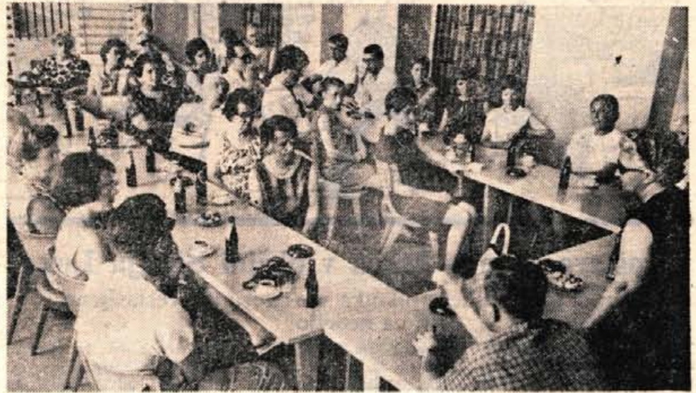
Kranj, petek, 5. julija — Danes dopoldne je prispela na enodnevni obisk v kranjsko občino 30-članska študijska delegacija iz Frankfurta, ki je te dni gost zveze delavskih univerz Slovenije. Dopoldne so se v delavskem domu v Kranju pogovarjali s predstavniki kranjske delavske univerze. Ogledali so si tudi kranjsko tovarno Planika, nekatere kranjske kulturne zanimivosti ter Jezersko in Preddvor. (A. Z.)