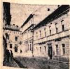
Hotel in restavracija PLANINKA Kamnik

Obiščite nas, postreženi boste z domačo kuhinjo in pijačo.