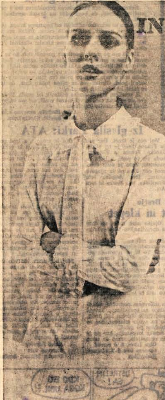
V vročih poletnih dneh se najbolje počutimo v takih bombažnih oblekah. Na sliki je bela srajčna obleka z romantičnimi čipkami okoli ovratnika in manšet.