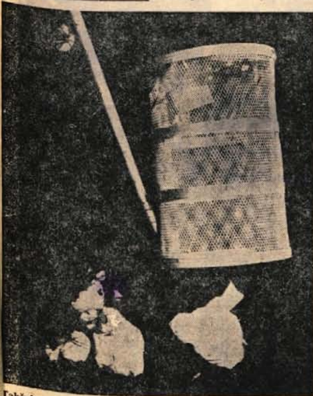
Takšni smo. Včasih so nam tudi košarice za smeti na poti

Kokra, Preddvor, Rodine, Kokrica, 3. julija 1968