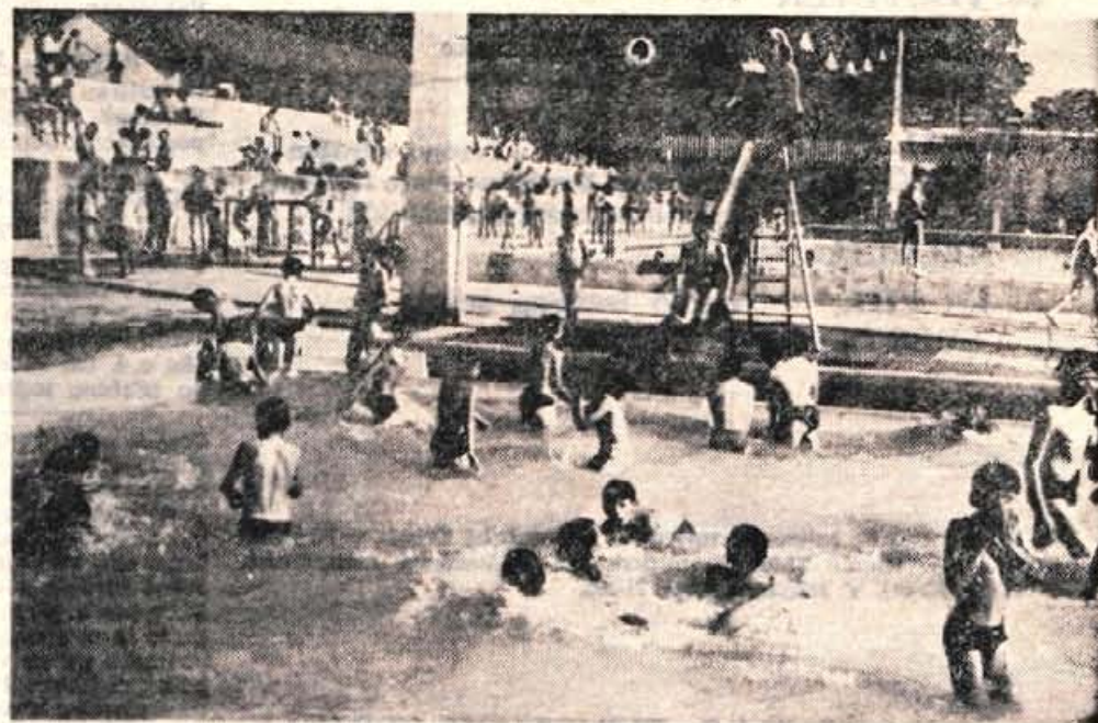
Prvi toplejši dnevi so tudi na kranjsko kopališče privabili kopalce