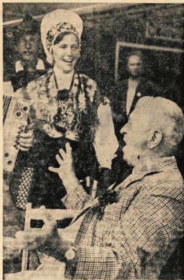
»Adijo, pa zdrava ostani...« je zapel ganjeni izseljenec ob spremljavi harmonike v rokah fanta v narodni noši.