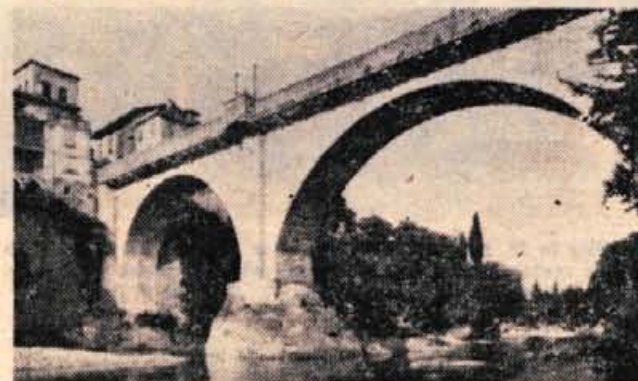
Vražji most v Čedadu

Ivan Trinko, s pesniškim imenom Zamejski, pač, ker je živel »za mejo«, je bil izjemen človek, vsestransko nadarjen. Bil je pesnik, pisatelj in filozof. Pisal je jezikovne slovnice in učene razprave s področja zgodovine in geografije. Kot da bi slutil črne dneve usode svojih rojakov, je hitel opisovati svojo deželo, nje narodopisno bogastvo, običaje in lepote dolin ob Beli, Teru in Nadiži. Dopisoval in sprejemal je v svojem domu doma-