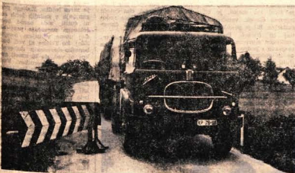
To sliko smo objavili v našem časniku že 15. junija. Konec maja se je namreč v Zgornjih Bitnjah pri Kranju udrla škofjeloška cesta. Cesta še vedno ni popravljena, ampak so ob udrtnih le opozorilni znaki. Vozniki se sprašujejo, kje je vzrok odlašanja?!