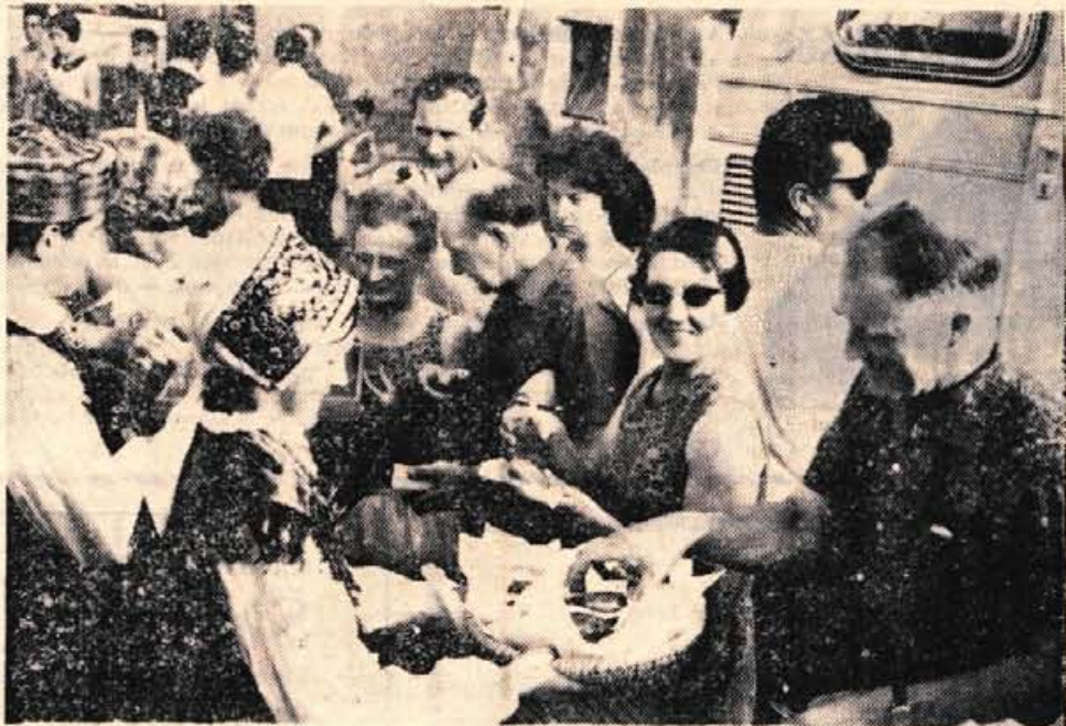
Nekako takole je vsako sredo na Okroglem pri Kranju