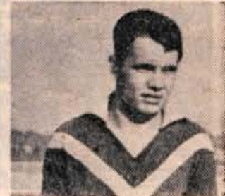
Bucalo (Triglav) je rešil čast Triglava v igri z bivšimi igralci povojnega moštva kranjskega Korotana