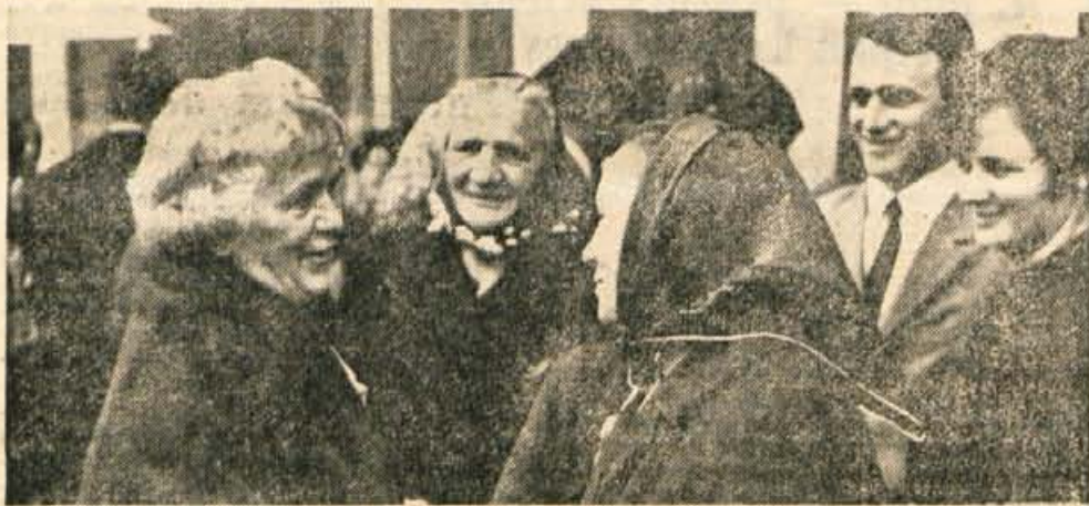
V nedeljo dopoldne se je na brniško letališče pripeljalo 63 izseljencev iz Avstralije, ki bodo ostali več tednov pri svojcih v domovini. Na letališču so jih sprejeli tudi predstavniki Slovenske izseljenske matice. Se posebej prisrčno pa je bilo srečanje s svojci.