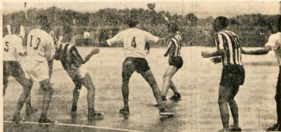
Zelo zanimive so bile tekme v rokometu med moškimi ekipami na letošnjem festivalu bratstva in enotnosti v Kranju. Po dramatičnih igrah so prvo mesto presenetljivo osvojili Kranjčani. Na sliki: Pristina: Bosanski Samac

REZULTATI: moški — 100 m prosto: 1. Matič (Zagreb) 1,00,0; 2. Brezec (Kranj) 1,02,8, 3. Stružnik (Kranj) 1,07,4; 100 m prsno — 1. Sermek (Zagreb) 1,19,6, 2. Grošelj (Kranj) 1,22,0, 3. Zupanc (Kranj) 1,22,8, 4. T. Slavec (Kranj) 1,26,8; ženske — 100 m prosto: 1. Zuani (Reka) 1,09,8, ... 3.—4. Virnik in Mihelič (obe Kranj) 1,14,4, 100 m prsno: 1. Švarc (Kranj) 1,21,8, 2. Mandele (Kranj) 1,25,6 itd. P. Didič