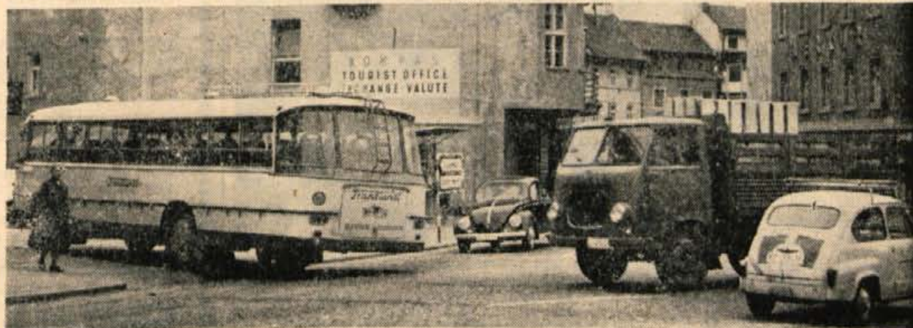
Ko se bo začela še glavna turistična sezona, bo kranjsko ozko prometno grlo postalo še bolj izrazito

zen one, ki ji pravimo avto cesta, vendar je njena gradnja predvidena šele po letu 1974 — zaradi ekonomskih prilik neizvedljive. A. Z.