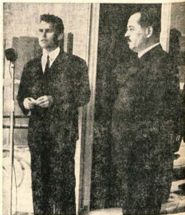
V soboto dopoldne je podpredsednik skupščine občine Domžale odprl letošnji domžalski sejem.

Tako spomladanski kot jesenski sejem prireja Zavod za propagando v Domžalah. Vsako leto obišče domžalski majski sejem od 25 do 30 tisoč ljudi. Odprt bo do 3. junija.