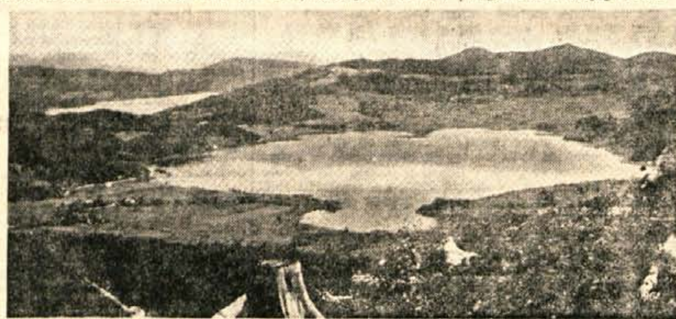
Drabosnjakova pokrajina v Rožu

Družina je bila zares števna — skrbi zanjo torej več kot dovolj. Kmetija pa je bila le srednjevelika. Ime- la je več gozda pa manj po- lja. In zato Drabosnjakova bukovniška vnema res ni