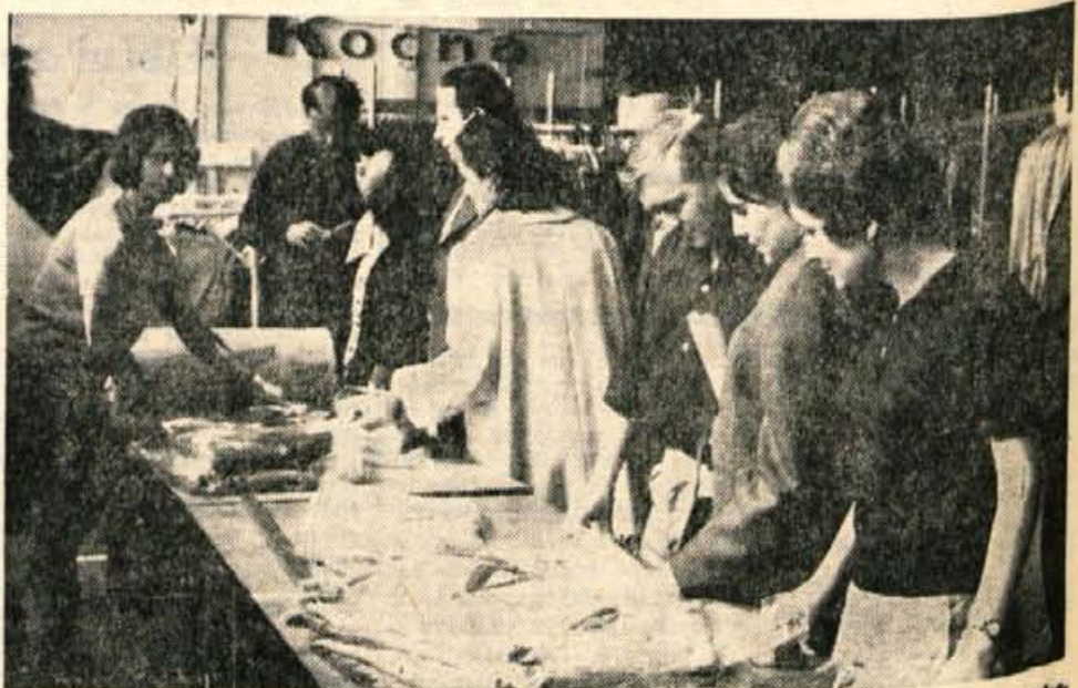
Takoj po otvoritvi sejma so imeli prodajalci že polne roke dela. Na sliki: v paviljonu trgovskega podjetja Kočna iz Kamnika.