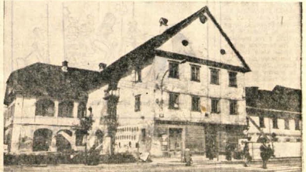
V ponedeljek so na vrhu Jelenovega klanca začeli pripravljati teren za gradnjo novega kranjskega hotela. Stare hiše, med njimi tudi znana Rossova, se bodo morale umakniti modernemu hotelu, ki bi arhitektonsko povezoval stari in novi del mesta.

Očiščene in zmrznjene morske ribe v prodajalnah Žvita Kranj