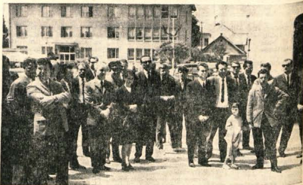
Gostje in domačini pred otvoritvijo sejma.