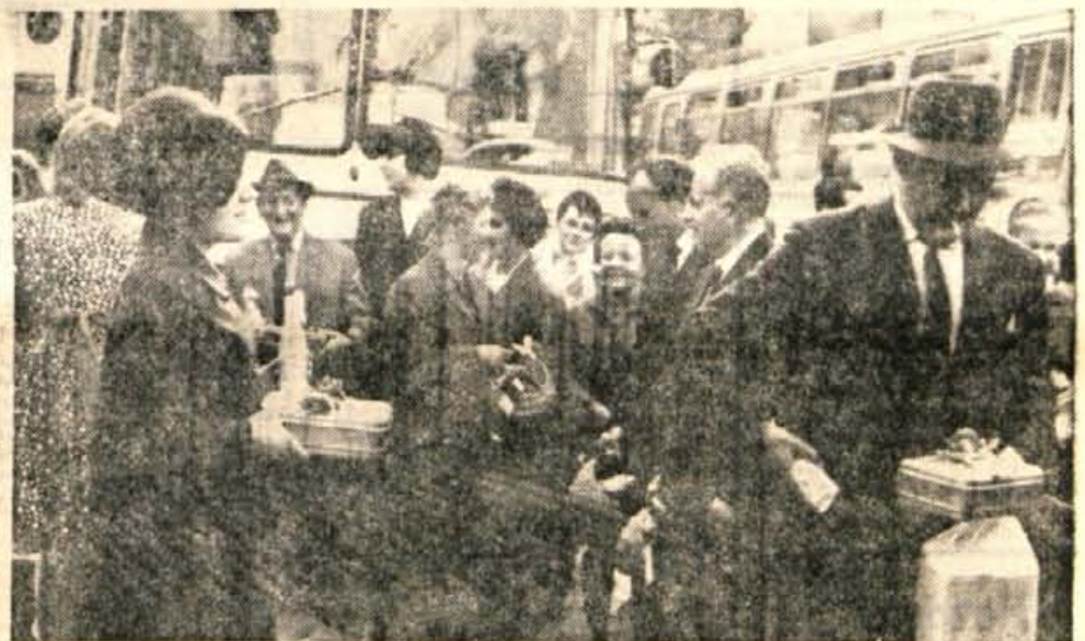
V soboto zjutraj so se srečni izžebanci — naročniki Glasa z dvema avtobusoma podjetja Avtopromet Gorenjska odpeljali na enodnevni izlet v neznano. Več o izletu bomo pisali v sobotni številki Glasa.