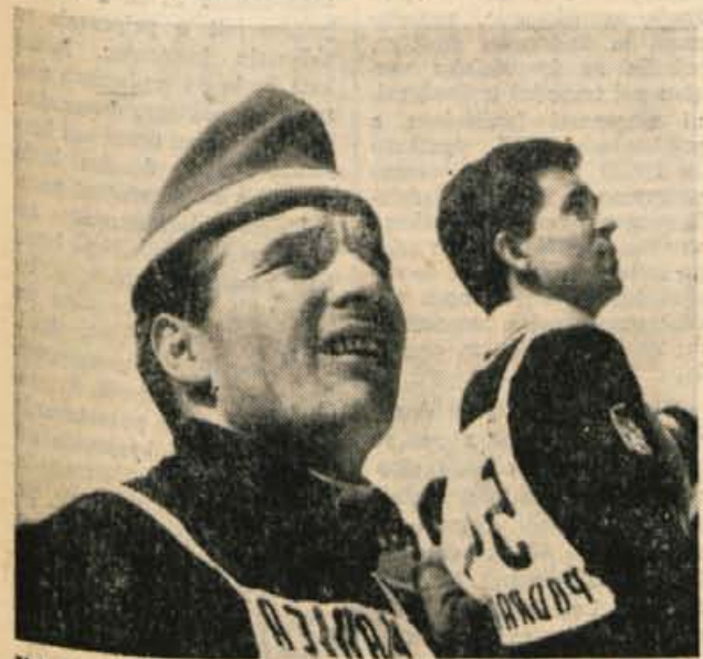
Jih Raška (CSSR) olimpijski zmagovalec v Grenoblu je bil dvakratni zmagovalec letošnje Planice in novi rekorder 90-metrake skakalnice (96 m).

GLASILO SOCIALISTIČNE ZVEZE DELOVNEGA LJUDSTVA ZA GORENJSKO