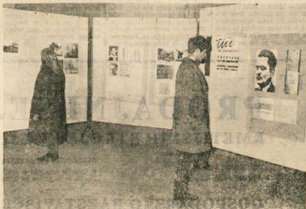
V sredo je delavska univerza Radovljica v graščini odprla razstavo Tito na Gorenjskem