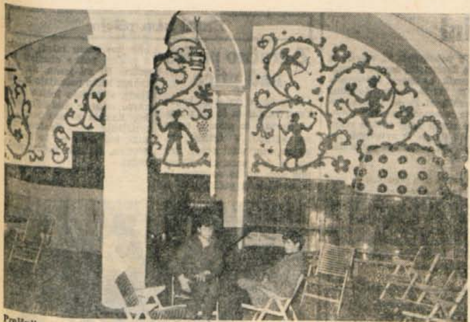
Prejtnji mesec so mladinci radovljiške občine dobili klubski prostor, ki so ga sami preuredili. Tako se je tudi mladim v Radovljici uresničila dolgoletna želja