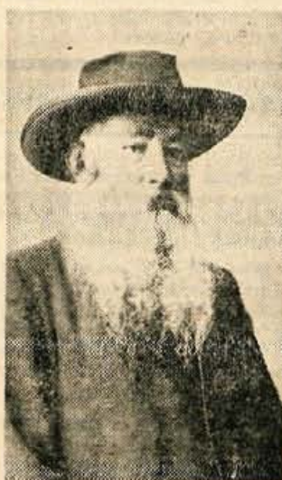
Pisatelj dr. Janez Mencinger (26. 3. 1838 — 12. 4. 1912)

Pilj so ti »akademiki« domače Mayerjevo pivo, prijazno »meniško« vino iz Kostanjevice in ognjevitno špansko marsalo.