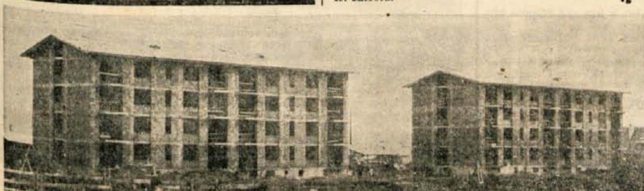
Tako kot lani tudi letos gradi nova stanovanja v Kranju Splošno gradbeno podjetje Projekt

Prošnje z dokazili je treba poslati najkasneje v 15 dneh po objavi na gornji naslov.