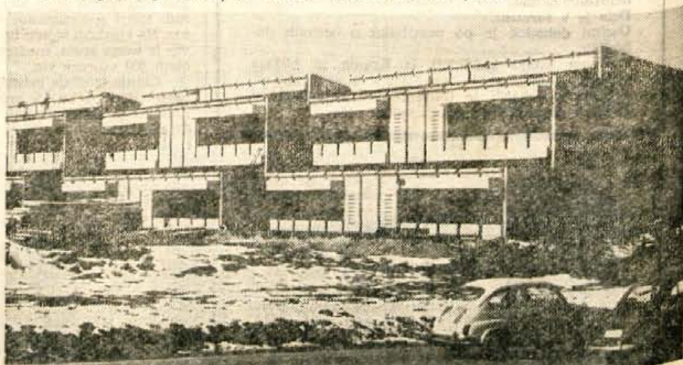
Dela pri gradnji nove osnovne šole v zadnjem času normalno potekajo. Pred kratkim so končali namreč že tretjo stopnjo gradnje. Tako bodo kmalu začeli ugrajevati že okna in vrata. Prav tako sta končana tudi že centralna kurjava in vodovod. Zato lahko trdimo, da se bo v njej jesen že začel pouk

Odlok o spremembi in dopolnitvi odloka o komunalnih taksah v občini Skofja Loka, ki ga je občinska skupščina sprejela na zadnji seji, med drugim določa, da lastniki vikend hiše plačujejo turistično takso v letnem pavšalnem znesku 200 novih dinarjev. Ker so odborniki menili, da je taksa v tej višini preizkoma odmerjena, saj naštetih uporablja vikend kot stanovanjsko hišo, so na seji sklenili predlagati republiški skupščini, naj uzakoni obdavčitev vikendov.