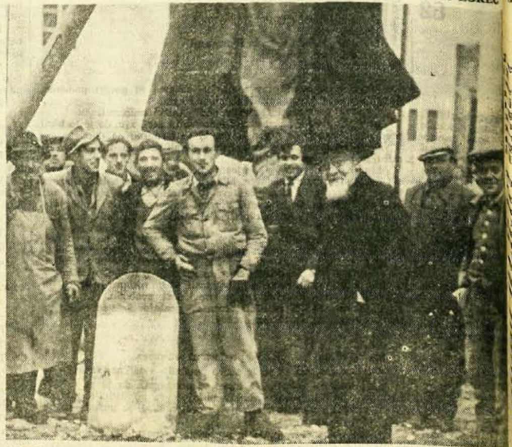
Arhitekt Plečnik med delavci v Kranju