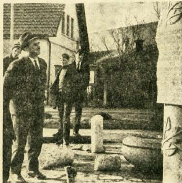
Spomenik v Zabnici, ki je bil tudi »žrtev« Vinka Kopača