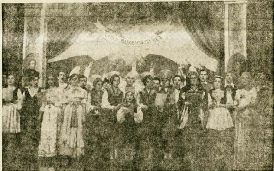
Prizor s čitalniške »besede« v Kranju

Vaštetova smo v letih po vojni uvrščali med najbolj brane in priljubljene slovenske pisateljice. Njen Roman o Prešernu je izšel kar v več ponatisih, zelo pa so bila čitana tudi druga njena dela, kot so npr. Gričarji, Upor, Izobčenec (roman o Janezu Trdini) in avtobiografske Podobe iz mojega življenja. —