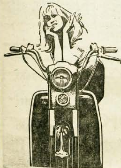
Tovarna motornih vozil TOMOS KOPER