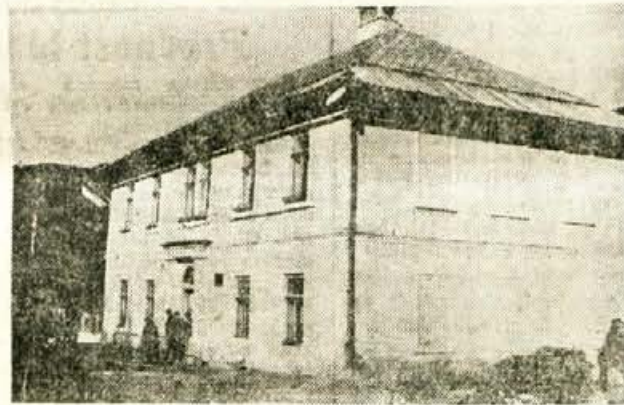
Osnovna šola Kranjska gora