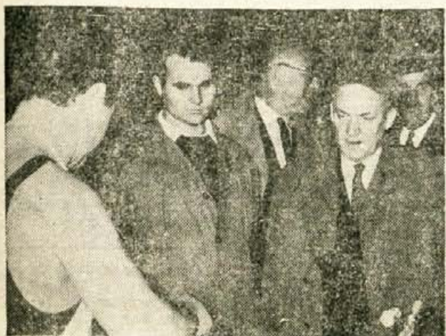
Med obiskom v kranjski občini si je predsednik skupščine SRS Sergej Kraigher minuli četrtek ogledal tovarno SAVA

SLUŽBA DRUŽBENEGA KNJIGOVODSTVA počrtnica 515 Kranj