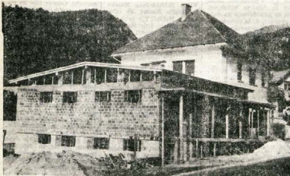
Specerija Bled namerava v Begunjah odpreti novo samopostrežno trgovino. V teh dneh so stavbo pokrili, spomladi pa bodo z deli nadaljevali