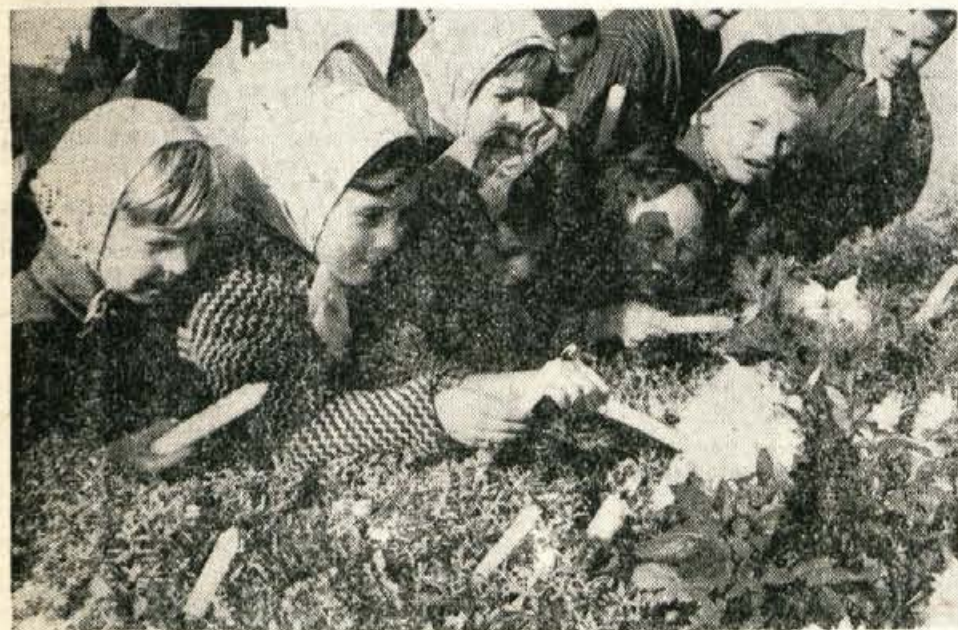
Otroci so v teh dneh obiskali grobove in spomenike, v spomin prinesli cvetje in prižgali svečke

Cena 40 par ali 40 starih dinarjev List izhaja od oktobra 1947 kot tednik, Od 1. januarja 1958 kot poltednik, Od 1. januarja 1960 trikrat tedensko, Od 1. januarja 1964 kot poltednik, in sicer ob sredo in soboto