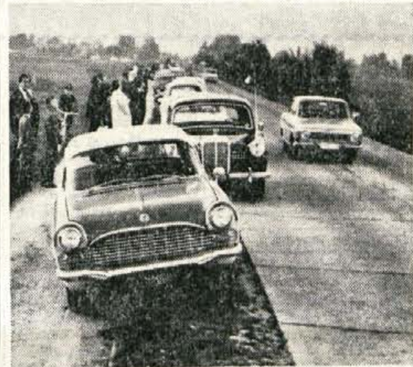
Prometna nesreča? Ne, le pogled na cesto ob letališču Lesce. Na glavni cesti se ustavljajo kolone avtomobilov, ljudje izstopajo in opazujejo letalce. Ob takšnih primerih bi bilo res nujno, da se v to smer včasih zapelje avtomobil letече mllice, kajti drugače bomo lahko v kratkem s podobno sliko poročali o nesreči.

Za nesrečo so v Kranju zvedeli v nedeljo zvečer. Čez pol ure so že odpotovali in razen krajšega odmora v Zoisovi koči hodili in plezali vso noč. Pri reševanju je delovalo osemnajst gorskih reševalcev, med katerimi je bilo pet zdravnikov. Reševanje je bilo zelo težko, saj so pokojnikovo truplo prenesli v dolino po 22 urah. Prav ob tem reševanju — kot pravijo — bi precej pomagal helikopter, žal pa ga za take primere še nimamo.