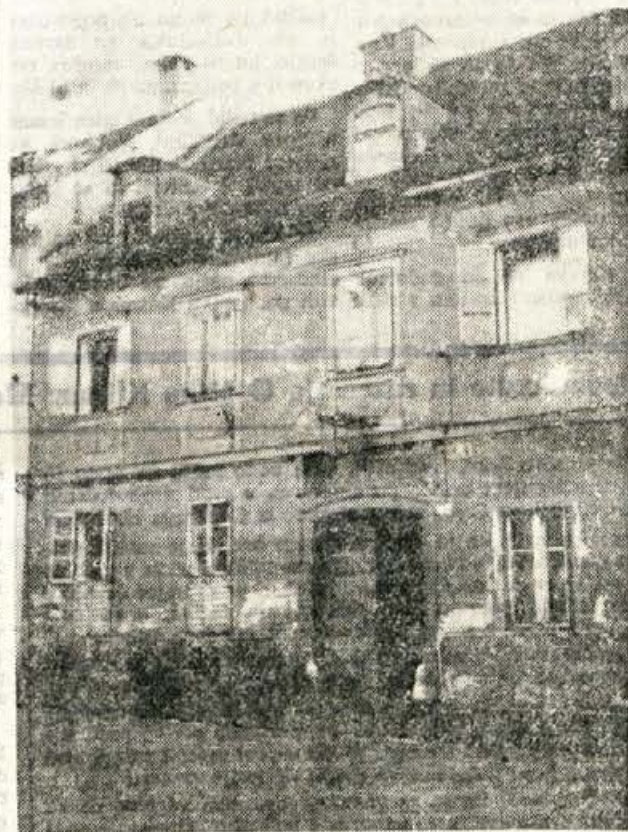
LOZARJEVA GOSTILNA v ljubljanski Rožni ulici št. 15

Utrujeni smo bili od študija, zeblo nas je, naši želodci so bili prazni kakor naše mošnje, pa tudi en malo žleht smo bili.