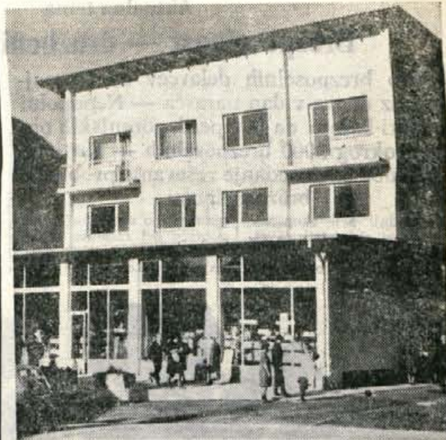
Nova samopostrežnica trgovskega podjetja Zarja Jesenice na Koroški Beli.

Zakaj je teh zborov tako malo, ni težko odgovoriti. — Predvsem zato, ker manjka glasbenih pedagogov ali bolj zborovodij. Se šole jih imajo malo, večina od teh pa ni posebej usposobljenih za zborovodstvo ali pa so v šolah toliko zaposleni, da ne najdejo časa, da bi prevzeli tudi zbor v kulturni organizaciji. — Kdaj bo dovolj učiteljev glasbe ali zborovodij, je vprašanje! Ceravno študirajo na pedagoški akademiji in na univerzi, se na terenu še vedno občuti močno pomanjkanje tovrstnega strokovnega kadra. S tem problemom se ubadajo tudi kulturne organizacije in občinske zveze Svobode in nič manj tudi šole. J. B.