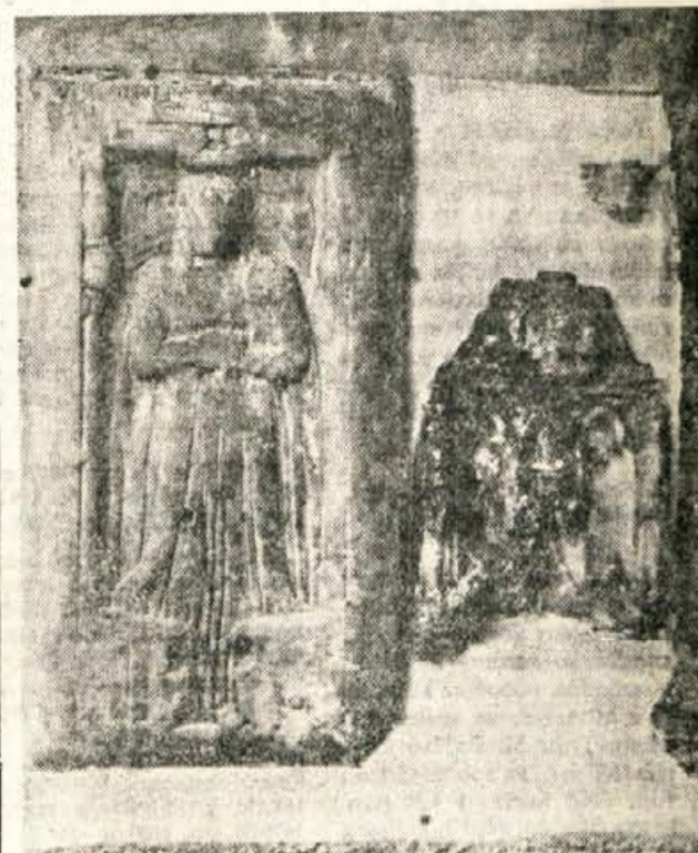
Nagrobna plošča iz 16. stoletja, del gotskega relikviarja in ostanek prvotnih vrat

Zakaj so naši predniki na zunanje cerkvene stene tako pogosto upodabljali prav Krištofa? Če raziščemo, v kakšnem prostorskem odnosu sta upodobitev Krištofa na cerkvi in naselje (vas), bomo ugotovili, da je Krištof vedno na tisti cerkveni steni, ki je obrnjena proti naselju, proti staremu jedru naselja. Ljudje so namreč verovali v posebno Krištofovo moč. Takole so menili: če zjutraj najprej zagledaš sv. Krištofa, potem tistega dne gotovo ne boš umrl nepredvidene smrti. To staro legendo pa so ljudje pozneje po svoje predelali tako, da so menili: če zjutraj zagledaš Krištofa, potem tistega dne sploh ne boš umrl. Zato to-