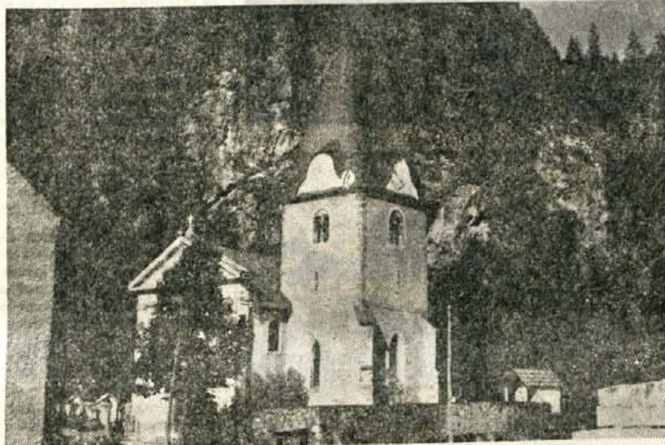
Starinska župna cerkev v Ukvah

Zgodovinsko društvo za Gorenjsko, ki organizira tudi letošnje potovanje »Po Prešernovih stopinjah na Koroškem«, nudi bralecem te rubrike možnost, da se udeležijo izleta. Ker je še nekaj prostih mest v avtobusu, se lahko prijavi za letošnji izlet še kak bralec naših rubrik. Potovanje bo izvedeno v soboto, 21. in v nedeljo 22. oktobra. Podrobnejše informacije lahko dobite na telefonski številki 21-898.