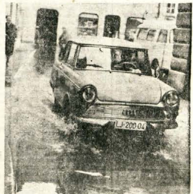
Ne samo sreča, ampak tudi precej spretni morate biti, da se v Jenkovi ulici umaknete nepriljetnemu srečanju

O teh in podobnih vprašanjih se bodo gorenjske občinske skupščine ponovno posvetovale z Vodno skupnostjo Kranj, ji predočile razmere na tem področju in zahtevale konkretnih akcij.