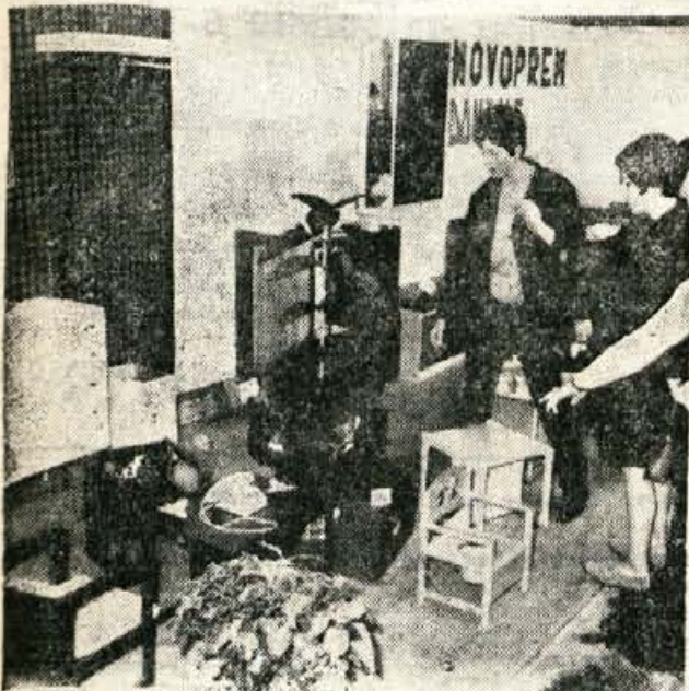
Minulo soboto so v Domžalah odprli jesenski sejem, na katerem razstavlja 54 razstavljalcev