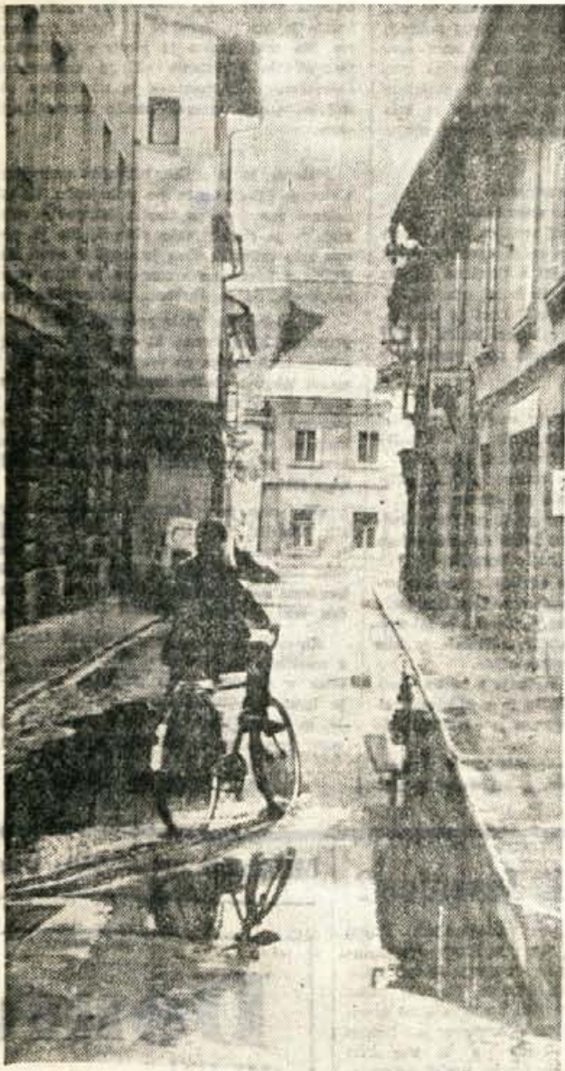
Jenkova ulica v Kranju po dežju. Prav gotovo ni v okras staremu delu mesta