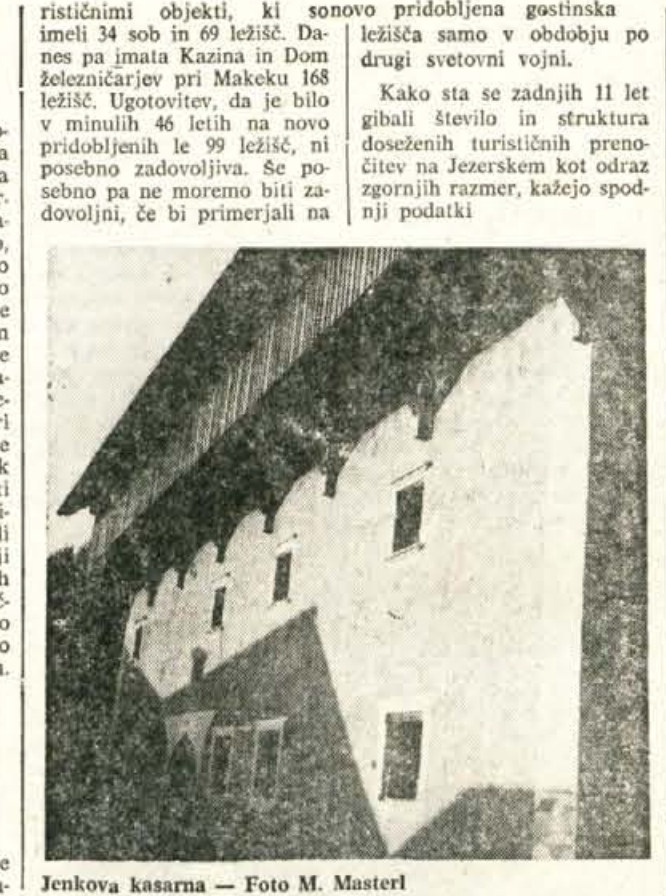
Jenkova kasarna

Jezersko (Nadaljevanje) Ki je bila med okupacijo Slovenije odstranjena s pročelja Kazine, sodi danes ali na Makekov dom, kjer se je dr. Chodounsky vsako leto za drževal ali pa na Češko koč, ki je v največji meri njegovo delo. Tako bi se le skromno oddolžili spomintu na češke pionirje, ki so na Jezerskem postavljali temeljne kamne slovenskemu turizmu in planinstvu ter hkrati dajali veliko oporo Slovincem pri ohranitvi njihove narodne zavesti. Hkrati pa bi na tak način le to skušali zamašiti vrzel v obisku čeških turistov, ki je nastala zaradi obeh svetovnih vojn. Zadnji dve leti je v Julijskih alpah srečevati že številne in močne skupine Čehov, ki bodo tudi radi obiskali nekdanjo svojo koč pod Grintavcem. III. TURISTICNE ZMOGLJIVOSTI NA JEZERSKEM IN OBISK TURISTOV I. Celotne zmožljivosti in promet V letu 1921 je Jezersko že razpolagalo s 6 gostinsko tu-