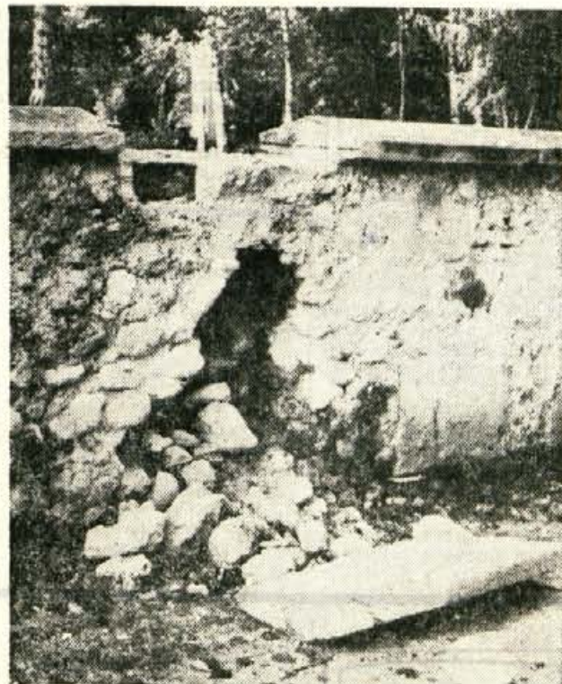
Vandalizem, malomarnost ali kaj? Kamnita ograja, ki obdaja Prešernov gaj v Kranju, se je porušila — ali pa jo je nekdo porušil. Kdo ve! Kakorkoli že, tako ne bi smelo dije ostati!

Taborišče je bilo razdeljeno na dva dela, ki ju je ločilo zborna mesto. Jeseni leta 1944 je dobilo po ukazu samega Himmlerja nov naziv, kar je edini primer pri vseh koncentracijskih taboriščih, in sicer: Vernichtungslager Flossenbürg (uničevalno taborišče). Samo taborišče je imelo 37 podružnic, med katerimi so bile najhujše Litomerice (Leitmeritz) na Češkem. Od tu ni bilo vrnitve. V samem taborišču je bilo okoli 16.000 internirancev. Skupno število tega taborišča pa je bilo po nepopolnih podatkih okoli 135.000 internirancev. Metode uničevanja so bile skoraj po vseh taboriščih enake, le proti koncu vojne je nastala velika razlika v tem, da so metode uničevanja po drugih taboriščih popuščale, v Flossenbürgu pa je bilo iz dneva v dan hujše. Pretepanja, mučenja, ubijanja je bilo toliko, da v zadnjih dneh dva krematorija nista zmogla sežgati vseh mrtvih, čeprav sta delala noč in dan. Zato so mrtve začeli polagati v skladišča, jih polili z nafto in