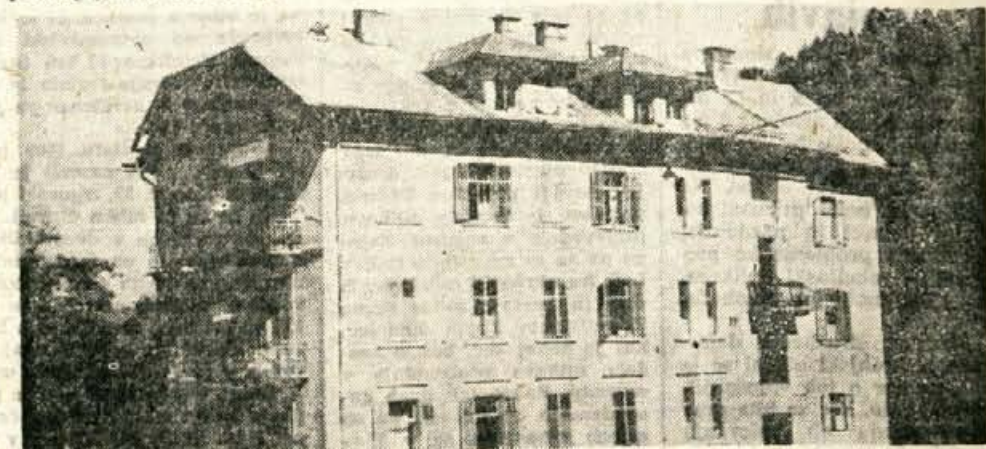
Stavba nekdanjega hotela Petran na Bledu (Mlino), ki jo nameravajo zaradi varnostnih, urbanističnih in turističnih razlogov porušiti

da se je energično lotila tega problema. V Radovljici namreč menijo, da objekt s praktično najslabšimi stanovanji na Bledu ne sodi k obali jezera in k cesti, ki pelje v Bohinj, zakaj ta prostor je predragocen za stanovanje. Urbanistični razlogi in turistične perspektive Bleda narekujejo odstranitev stavbe, prostor pa se kar ponuja za kakršnekoli turistične namene. Okvirni načrti za nadaljnji razvoj turizma na Bledu — nedvomno Bled za