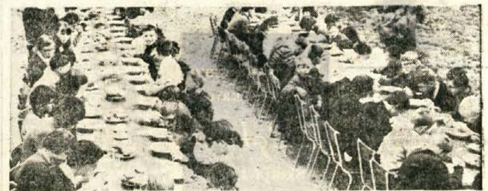
Slepi in slabovidni otroci iz ljubljanskega Zavoda za slepe in slabovidno mladino med kosilom na Okroglem

v zavodu le slepi otroci, šele zdaj so ga razširili tudi na učenje slabovidne mladine. »Po statistikah je v Sloveniji v šolah okrog 2000 slabovidnih otrok. Mi smo jih za zdaj zajeli le še malo, okrog 60; zanje smo ustanovili poseben oddelček. To naj bi bil začetek posebnih oddelkov za šolanje slabovidne mladine tudi na ostalih osemletnih šolah v drugih krajih po Sloveniji.« Pripovedovali so mi še, da so za slabovidne otroke potrebne posebne metode šolanja, če hočejo, da otrok napreduje tako, kot ostali učenci, ki dobro vidijo. Profesorji Zavoda so pripravili posebno čitanko za 2. in 3. razred za slabovidne otroke, ki bo kmalu izšla. To je prva taka čitanka v Jugoslaviji.