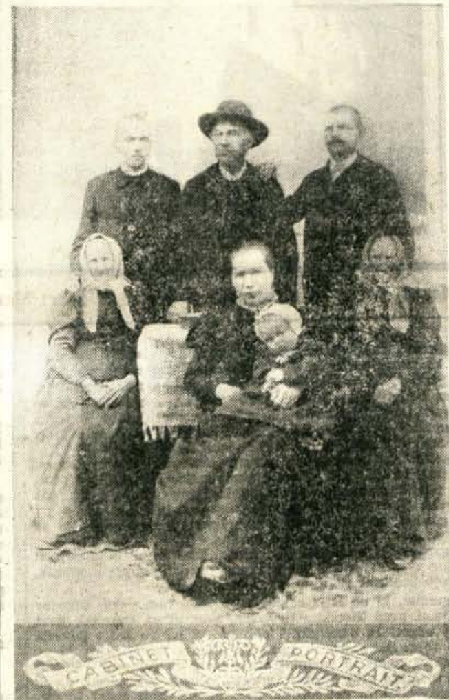
Pisatelj oče (v sredini s klobukom na glavi), na njegovi desnici semeniščnik Finžgar, spodaj, na desni pisateljeva mati

»Nekam neljubo zveni iz te knjige tudi beseda kmet. Zdi se nam vedno, da se rabi v zelo poniževalnem pomenu. Npr. čeprav je bil kmečki sin, imel je majhne roke in noge. Ali: kdor ima posla s kmeti, ve, koliko potrpljenja je treba, da se tem ljudem kaj dopove. Ali: stregla sta mu (na smrtni postelji) dva kmeta, dasi ju ni nobeden prosil. — Vse to in kar je podobnega, zveni preveč zaničevalno, zlasti izpod peresa osebe, ki je prav tako revnega in nizkega stanu.«