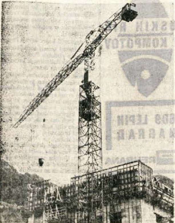
Na Jesenicah v teh dneh hitijo z gradnjo stanovanj. Pravijo tudi, da bodo do 1970. leta rešili stanovanjski problem borcev in upokojencev