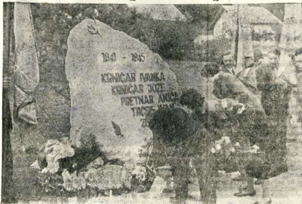
Ob odkritju spomenika na Poljanah nad Jesenicami so svojci položili vence.

Na Poljanah, v mali vasici med Javornikom in Blejsko Dobravo, so v nedeljo odkrili spominsko obeležje padlim borcem in žrtvam fašističnega terorja druge svetovne vojne.