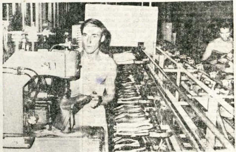
Tekoči trak v tovarni Peko, ki je skrajšal postopek za izdelavo čevlja od 24 ur na 100 minut.

Peko, proizvajalec modnih čevljev, bo letos prodal v tujino okoli 600.000 parov čevljev v vrednosti 2.800.000 dolarjev