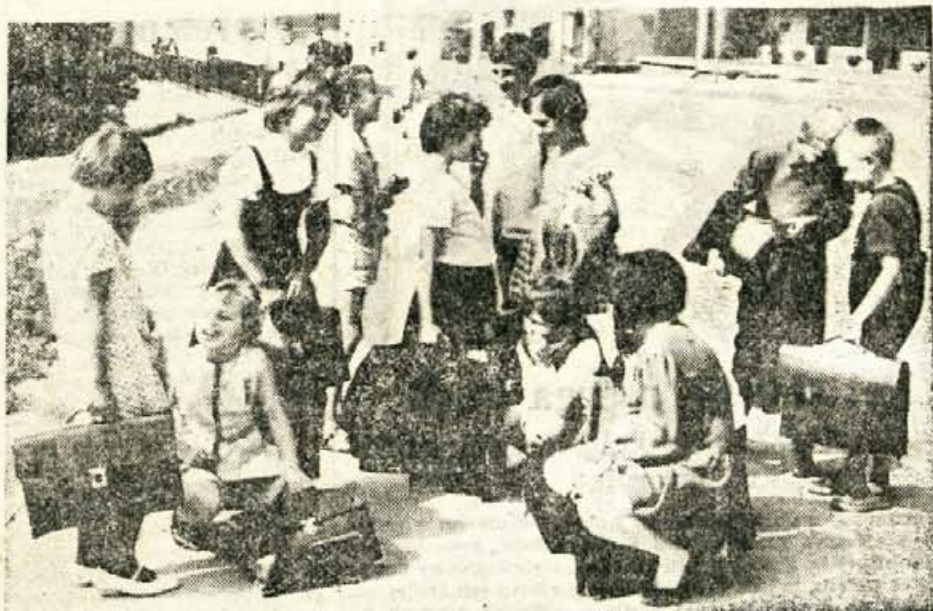
Odkar se je začela šola, takšni prizori niso redki