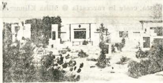
Kamniške Zale, kjer počiva pesnik Anton Medved