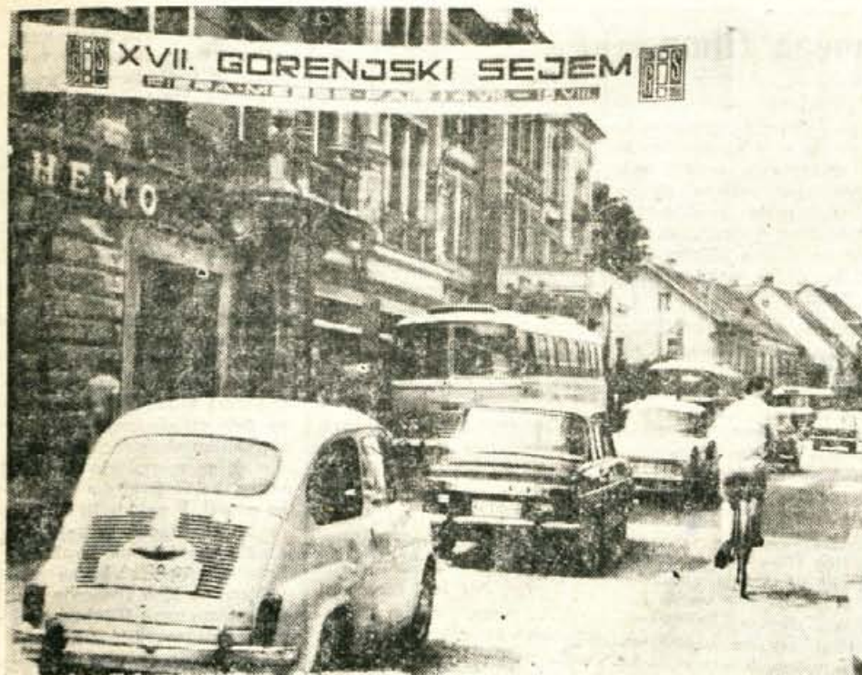
Kranj je v teh dneh živahen, res sejemski