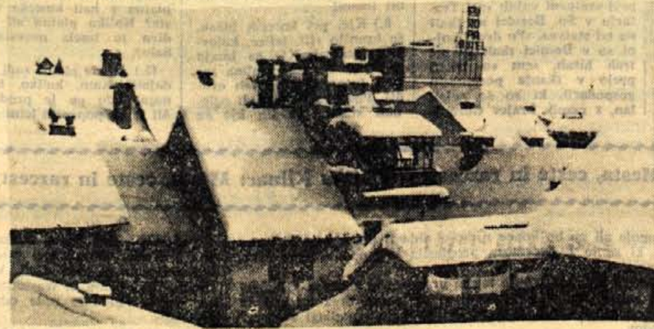
Strehe, dvorišča, sneg...

Blaž Potočnik, roj. 1799 v Struzevem pri Kranju. Pesnik, pisatelj in narodni buditelj. Sodeloval v Kranjski čbelici, Prešernov prijatelj. Mnogo njegovih pesmi je ponarodelo. Najbolj znani sta »Pridi Gorenc z mrzle planine...« »Ko dan se zaznava, danica priplava...«. Veljal je za učenega moža, ki je vse svoje znanje uporabljal za praktično ljudsko izobrazbo. Bil je avtoriteta v šolskih zadevah. — Njegovo literarno delo je pohvalil celo strogi esteta Matija Cop,