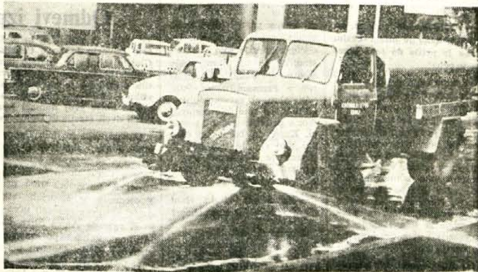
NOV ŠKROPILNI AVTO — Komunalni servis v Kranju je prejšnji teden dobil nov škropilni avto za pranje ulic. Prostornina rezervoarja je pet kub. metrov. S pritiskom 6 do 8 atmosfer lahko škropijo 16 metrov široko cestišče.

V lanski prvi tretjini leta je bila razlika med proizvodnjo in plačano realizacijo 5.850.746 N din, letos pa 8.088.235 N din. Razlika se je torej povečala za 37%, vendar pa vse ne izvira iz povečanih zalog izdelkov in povečane fakturirane in neplačane realizacije, temveč delno tudi iz višjega prikazovanja vrednosti proizvodnje.