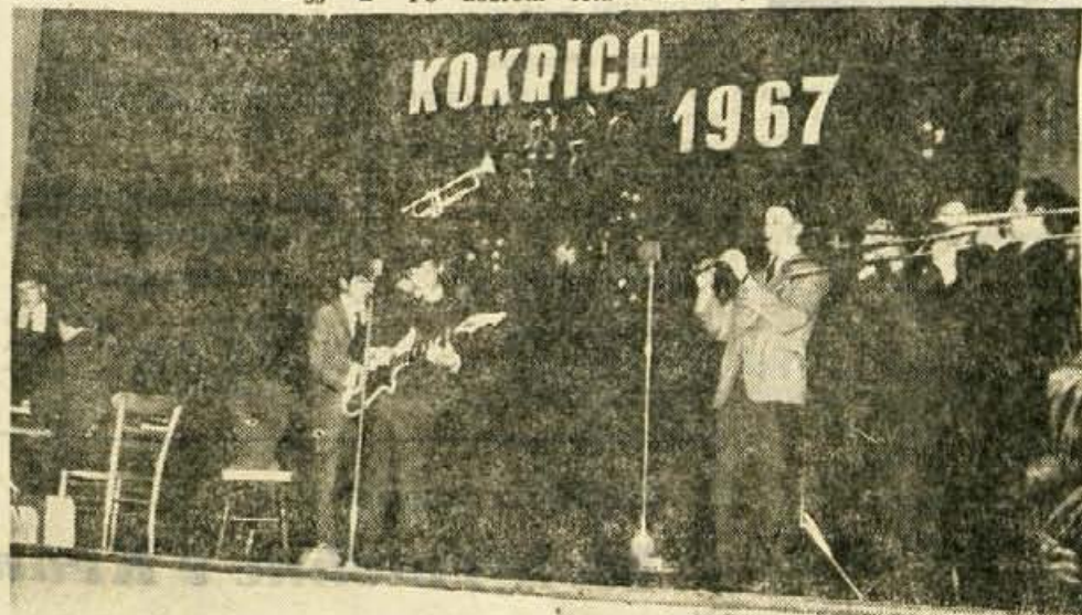
REVILJA ZABAVNIH ORKESTROV — Na Kokrici je bila v nedeljo popoldne revija zabavnih orkestrrov, ki jo je organiziral občinski svet zveze kulturno-prosvetnih organizacij, in sicer letos že drugič. Kokričani so revijo z zanimanjem spremljali, saj so napolnili dvorano zadržnega doma. Na sliki: ansambel Korus iz Skofje Loke — Foto: F. Perdan