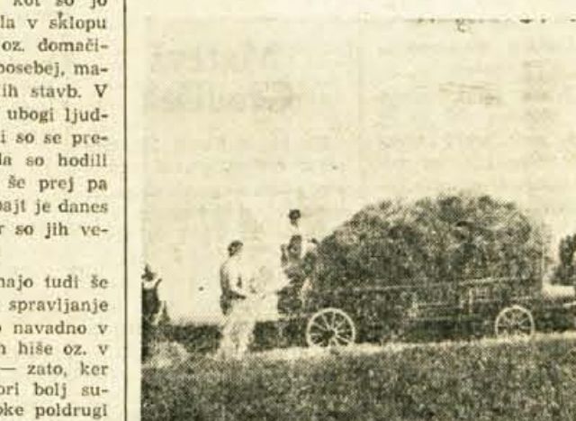
Nakladanje žita na voz na Sorškem polju