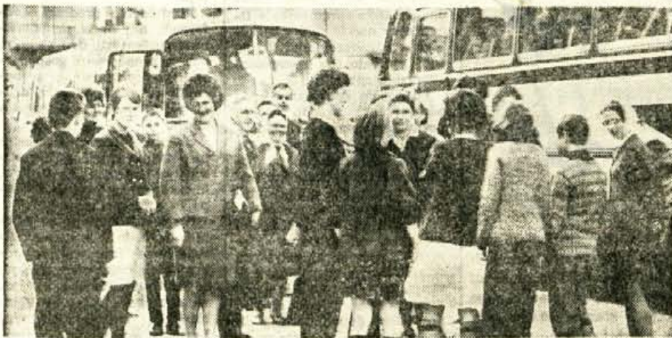
OTROCI ODSLI NA STENJAK — V petek prejšnji teden je s posebnimi Transturistovimi avtobusi odpotovala na Stenjak pri Pulji skupina otrok Posebne šole iz Kranja. Šola na prostem organizira posebna šola iz Kranja letos že tretjič. Na otoku Stenjaku pri Pulji bo letos preživelo tritedensko šolanje, združeno s prijetnimi počitnicami, 134 otrok — Na sliki: pred odhodom se otroci poslavljajo od svojih domačih