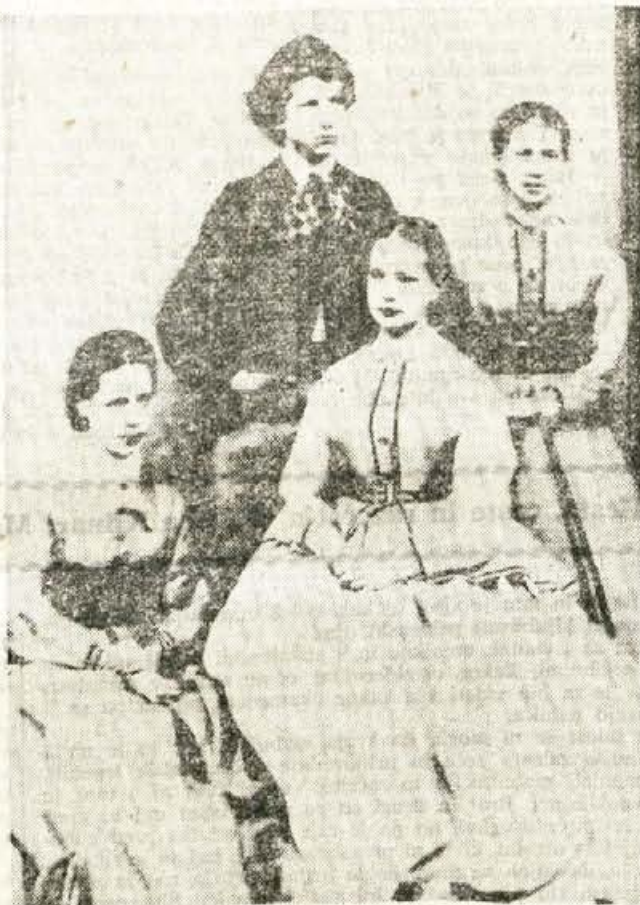
OTROCI JULIJE PRIMCEVE