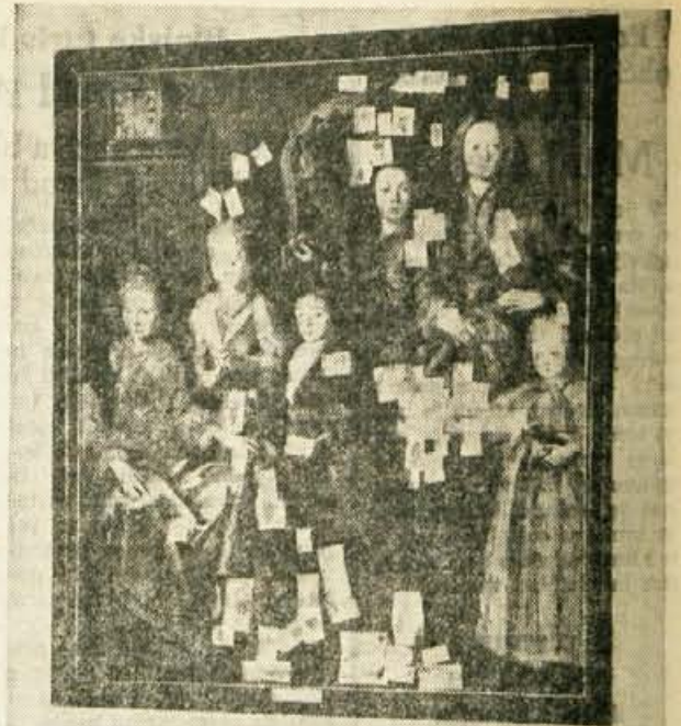
IZ LOSKEGA MUZEJA — V Loškem muzeju čaka rešitve volikanska slika skupinskega portreta družine barona Erberga, površine 5 m 2 . Restavriranje te slike bi stalo 300.000 starih dinarjev, vendar muzej za to nima potrebnega denarja.