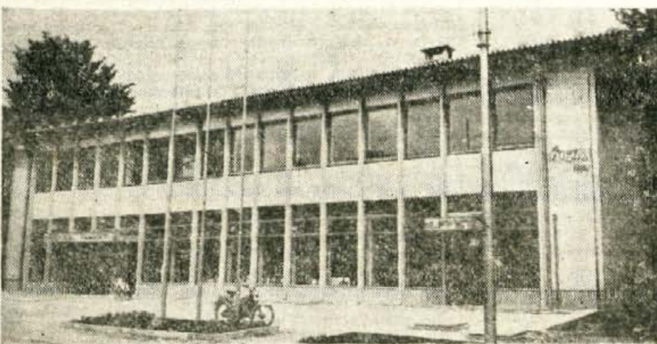
NOVA TRGOVINA NA BLEDU — Prejšnji teden so na Bledu odprli novo stavbo, v kateri sta bife in samopostrežnica, konec tedna pa bodo odprli še prodajalno mesa. Prostor pred novo trgovino v bližini bencinske črpalke bodo še ta teden asfaltirali in pred bifejem postavili 12 miz.