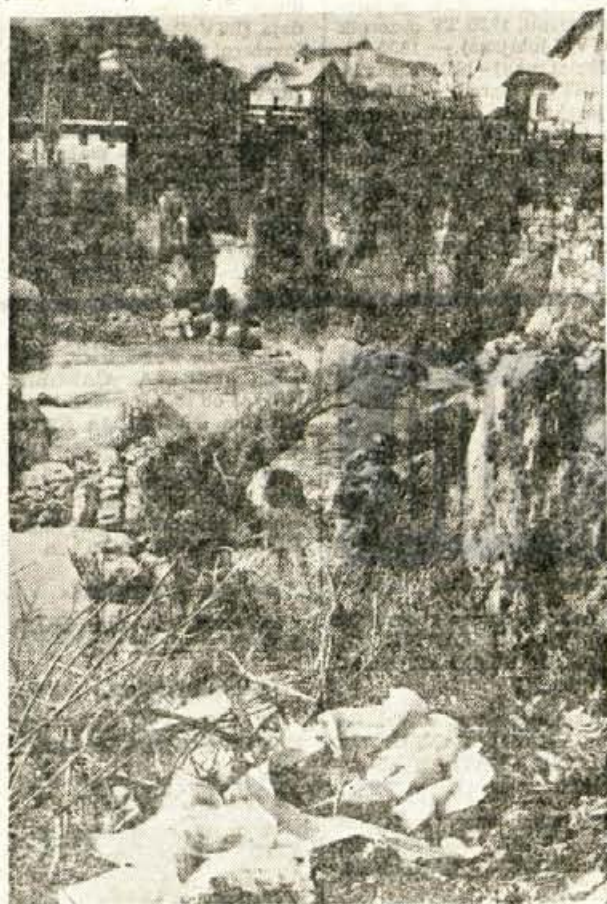
SMETISKA V SKOFJI LOKI — Posebna komisija skupščine občine Skofja Loka je tudi uradno ugotovila, da je obrežje Sove izredno zanemarjeno, saj se je spremenilo v pravo smetišče. Na sliki: nič bolje ni v neposredni bližini kopališča.

Vse prireditve bodo potekale pod geslom: »Storiti vse da bo otrok varen v prometu!« J. P.