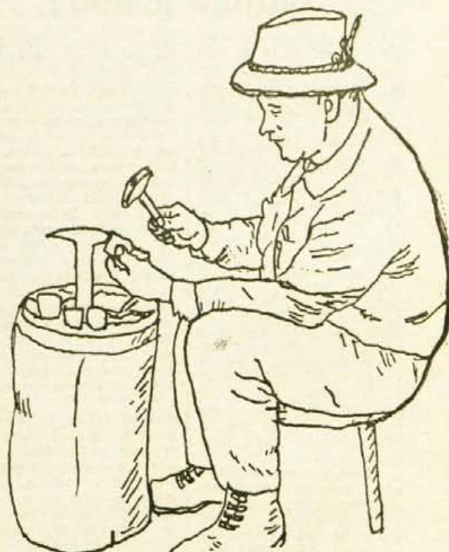
Po bokanju zavijuje zvončar na »šperakl« oba dela pločice v obliko zvonca