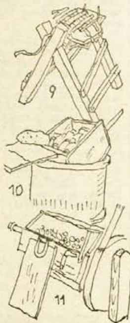
9 — »valavka«, kjer vrte »pušelj« po votanju; 10 — odprta »mišenca« z zvončanimi zvonci na čeburu vode; 11 — »drumla« za čiščenje zvoncev

Jože Ambrožič Poljšica (Nadaljevanje prihodnjic)