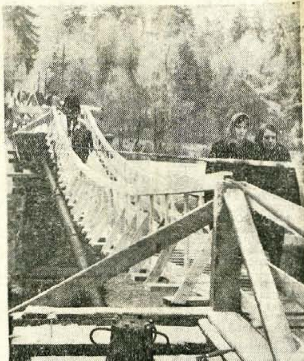
ZASILNA BRV, ki so jo naredili pred novim letom na odplavljenem mostu pri Tekstilindusu v Kranju je sicer delavcem precej skrajšala pot, vendar pa je res le »zasilna« in bi jo bilo potrebno ob višji vodl zaradi varnosti zapreti.