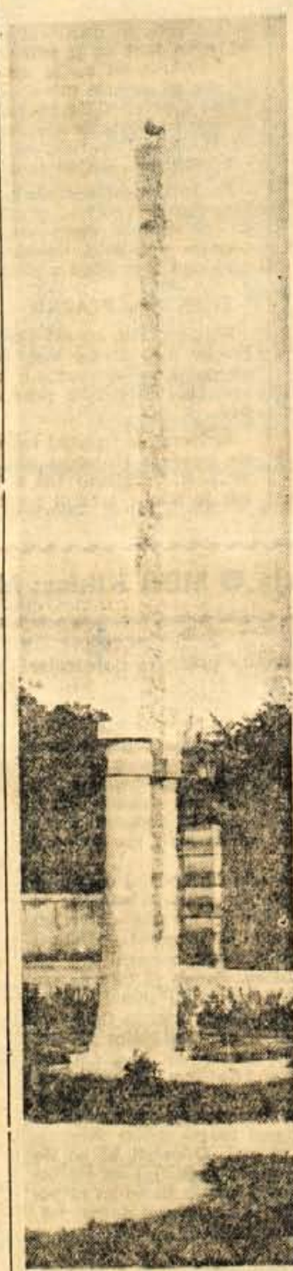
Plečnikov monolit v Pragi

Ce že v gledališče in k predavanjem zaradi svojih televizorjev ne hodimo, je do neke mere razumljivo. Z nasiljem ne bomo nikogar pripravili, da bi obiskoval kulturne prireditve. Lažko pa zahtevamo od vseh kranjskih