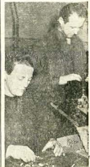
Pogled v tovarno NIKO v Železnikih.