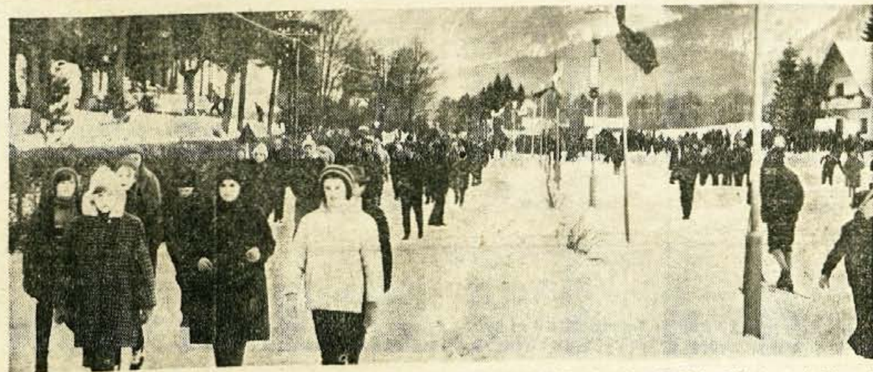
LETO TURIZMA — VIZA MIRU je bil naslov ob startu in cilju na tekaških tekmah v Bohinju. Celotna prireditev je izvenela v znaku ostrih borb in izmenjavanj izkušenj najboljših tekačev iz Srednje Evrope. Na sliki: najmlajši gledalci so v soboto in nedeljo preplavili Bohinj.

Spričo tega je razumljiv sklep občinske volilne komisije v Radovljici, da odborniki, ki jim bo letos potekel mandat, ne bodo mogli več kandidirati v skupščino — tudi v drugem zboru ne. Tudi volilne komisije pri ostalih občinskih odborih SZDL na Gorenjskem so razpravljale o tem in v načelu podprle take rešitve. Gre le še za to, da to uresničimo tudi v praksi!