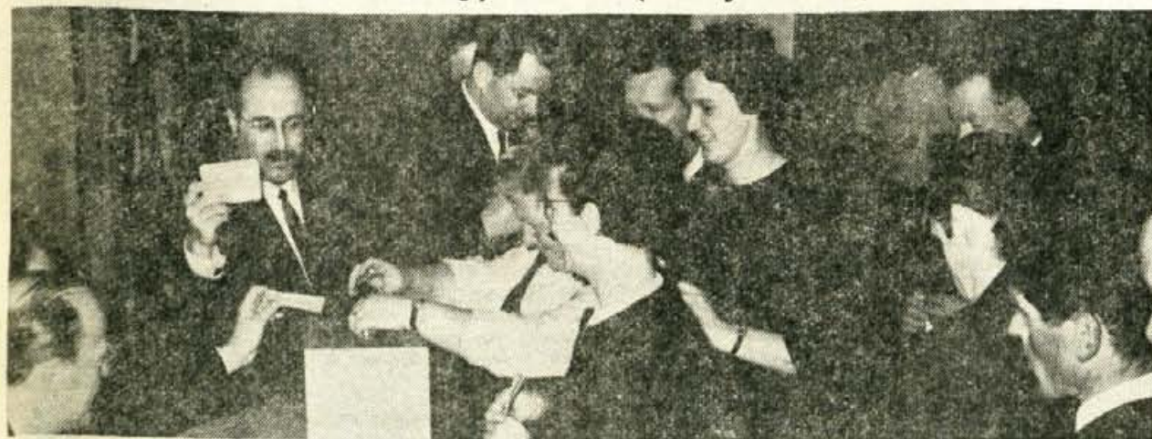
Odborniki kranjske občinske skupščine volijo zvezne in republiške poslance

V petek bo podpredsednik skupščine SRS dr. Breclj obiskal Kranj.