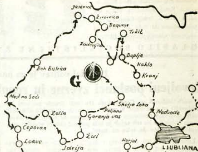
Kurirčkova pošta 1967