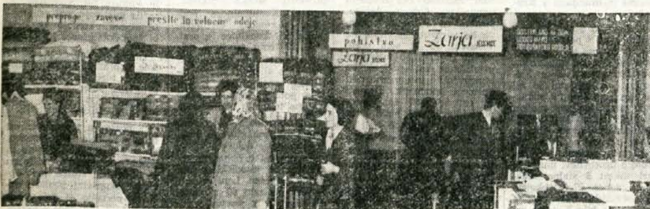
SPOMLADANSKI SEJEM V KRANJU — V soboto, 8. aprila, so v domu Franca Vodopivca v Kranju odprli spomladanski sejem blaga široke potrošnje. Na sejmu sodeluje 13 podjetij in 23 zasebnih razstavljalcev. Na sejmu je razstavljenih največ tekstilnih izdelkov, precej pa je tudi pohištvene opreme, tehničnih predmetov itd. Novost na sejmu je, da Ljubljanske opekarne razstavljajo in prodajajo opeko. V prvih treh dneh si je sejem ogledalo okrog 17 tisoč obiskovalcev, podjetja in zasebni razstavljalci pa so prodali za okrog 50 milijonov starih dinarjev različnega blaga. Sejem bo odprt do 17. aprila.

Naši ljudje bodo za naprej lahko potovali samo s potnim listom in brez vizuma v vse tiste države, s katerimi smo podpisali sporazume o ukinitvi viz. To je najbistvenjša sprememba v zakonu o potnih dokumentih naših državljanov, ki jo je te dni sprejela zvezna skupščina.