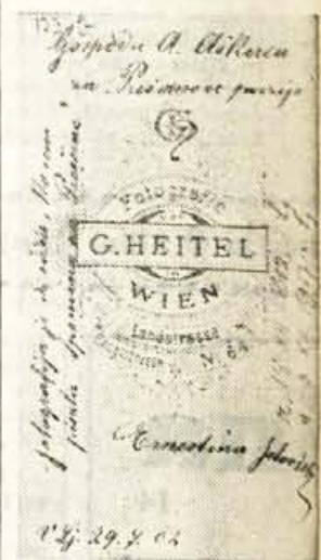
Ernestinino posvetilo svoje fotografije pesniku Antonu Aškercu, l. 1902