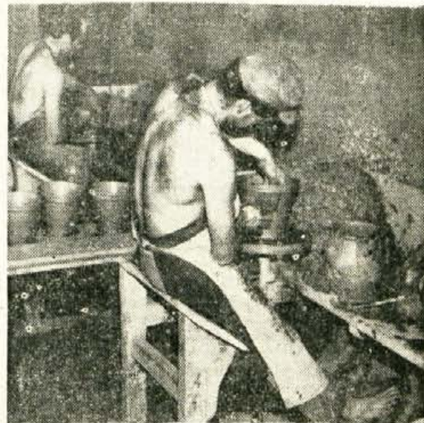
Lončar v lončarskem podjetju v Komeni dela na kolovratu cvetlične lonce

Sicer pa prosimo Komenčane in okoličane, da nam pišejo, kako oni v vsakdanjem govoru izgovarjajo. To bo najboljši dokaz, kaj je prav in kaj ne. A. Triler