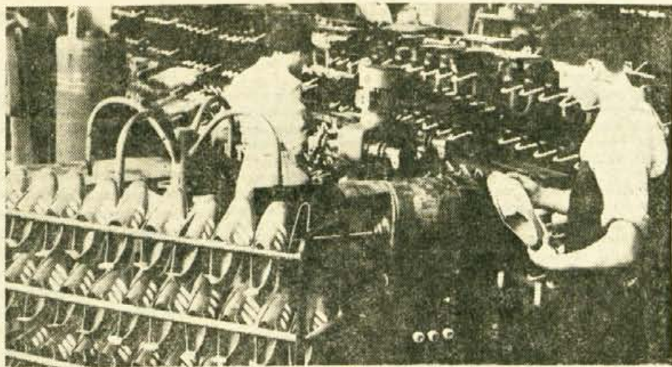
ADIDAS V JUGOSLAVIJI — Z izdelavo športne obutve Adidas-Planika in prodajo na domačem trgu imajo v Planiki izkoriščena dva tekoča trakova