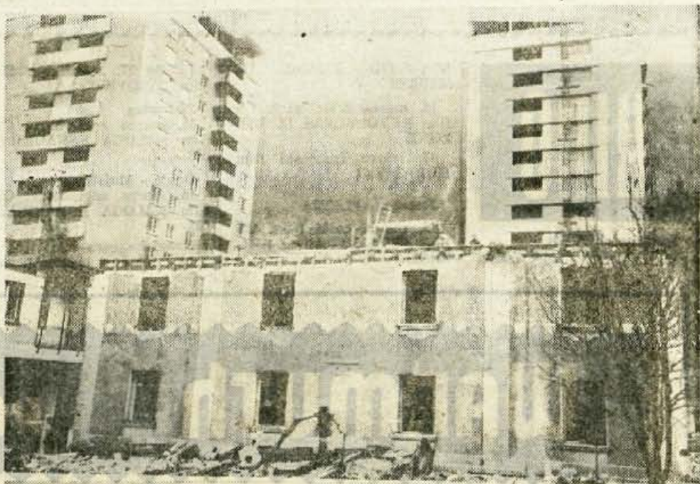
Na Jesenicah so v bližini gimnazije začeli rušiti staro stavbo, ki zapira pogled na stolpnice zadaj. Drugo staro stavbo v bližini bodo porušili pozneje. Rušenje narekuje urbanistično zidalni načrt mesta Jesenice. Na tem kraju bodo po urbanističnem programu zgradili novo moderno trgovsko stavbo, v kateri bodo razen poslovnih prostorov različnih podjetij še trgovina podjetja Zarja in moderna večja mlečna restavracija ter slaščičarna. Taka moderna stavba po urbanističnem načrtu edino sodi v to okolje in pomen. nekakšen vhod stolpnicam zadaj.

osemletke Lucijan Seljak pa so jim pripravili krajši program. Dan prej je oskrbovanke pripravila krajši program in jih obdarila tudi uprava doma. — š