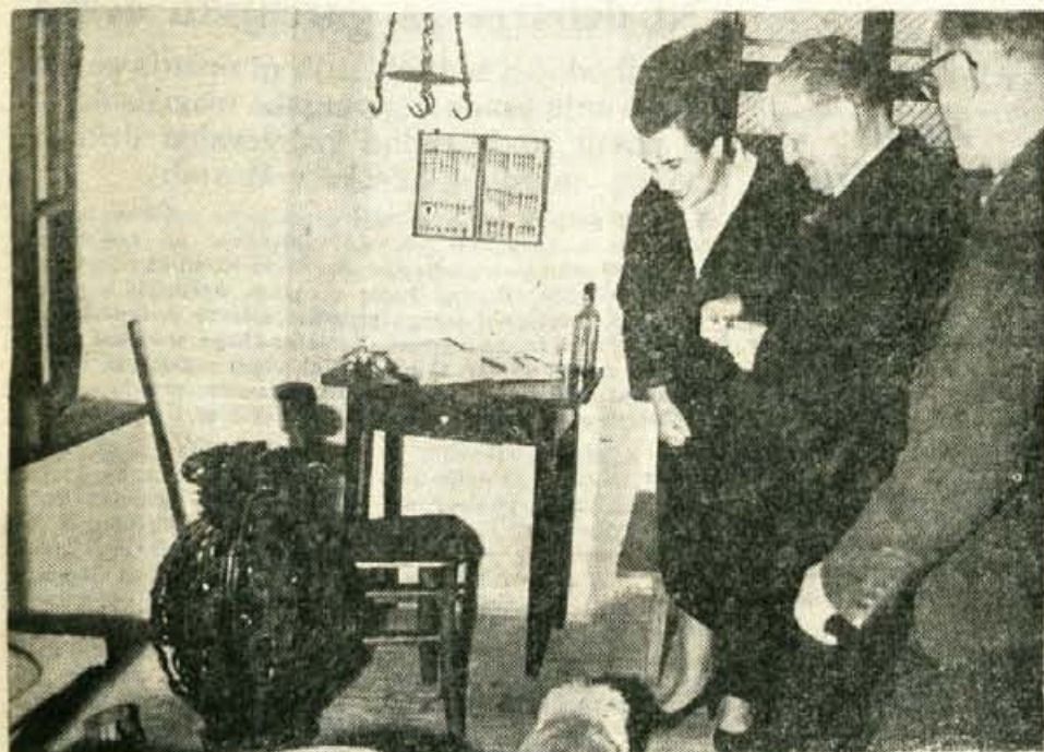
Predsednik Tito s soprogo Jovanko si ogleduje zbirke v Kovaškem muzeju