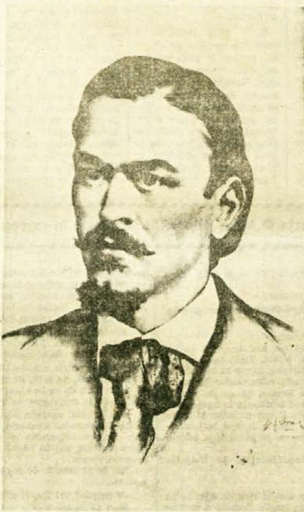
Josip Jurčič: 1844—1881 (kredna risba Božidarja Jakca)