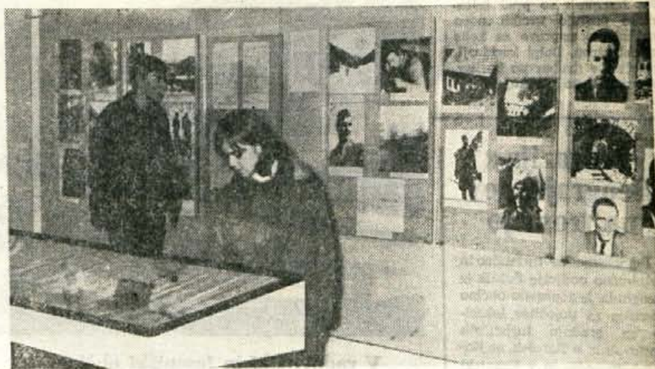
Z razstave o partizanskem tisku, tehnikah in tiskarnah na Gorenjskem; razstava je v galeriji Mestne hiše v Kranju