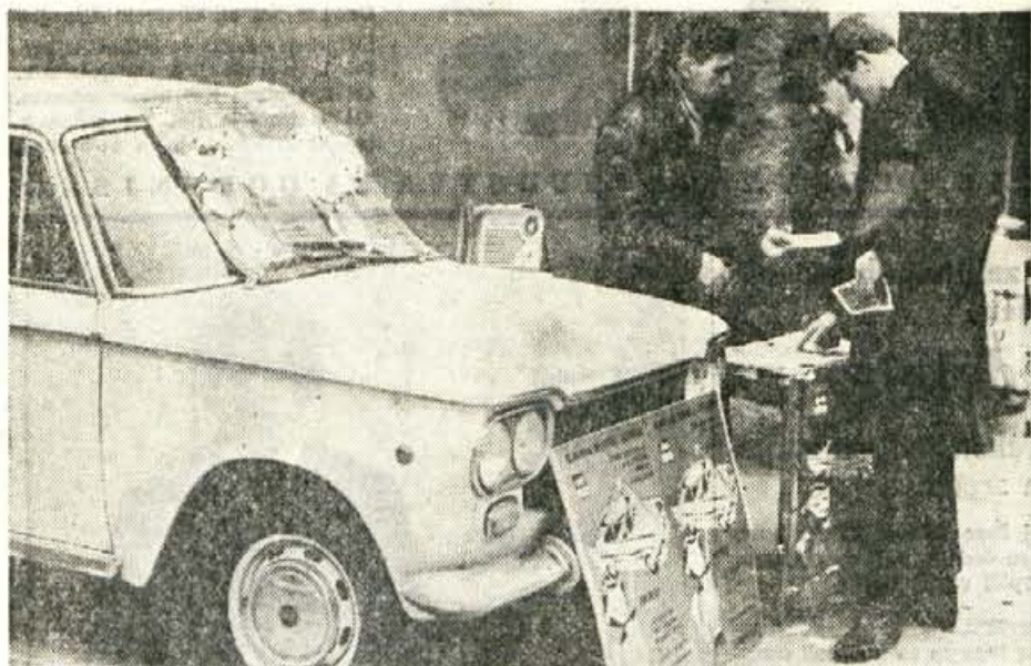
AVTOMOBIL ZA 500 S-DIN — Kdor nima denarja, da bi kupil avtomobil, si za 500 S-din kupi »sladko utvaro«, v obliki majhnega loterijskega listka. Potem se že vidi za volanom, zato ni čudno, da se igre na srečo vrste kar na tekočem traku