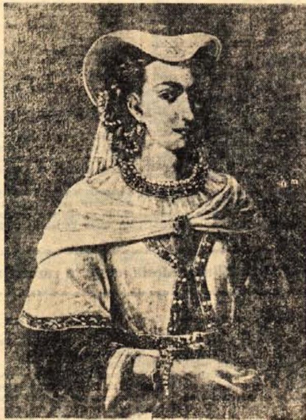
Virida Visconti — po sliki v ljubljanskem muzeju

Ker pa je bil Viridin soprog Leopold še mladoleten, je vlado v obeh delih habsburške Avstrije prevzel njegov starejši brat Albreht. Milanska knežna tega zasuka usode ni bila prav vesela, saj se je iznenada znašla pod varu-