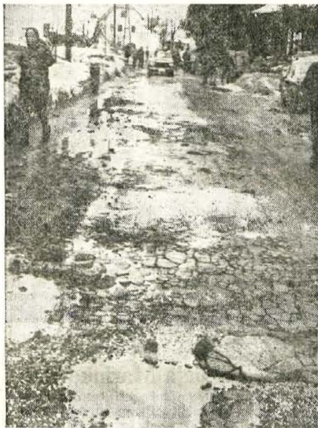
Po ukinutvi gornjesavske proge je cesta izredno obremenjena. Zato ni čudno, da je sedaj, ko je odlezel sneg na mnogih krajih tako »svzvetela«, da jo bo prav težko popraviti. Na sliki: Kranjska gora te dni

Da bi se mladinsko prestopništvo zmanjšalo, služba socialnega varstva pri skupščini občine Tržič predlaga, po zgledu Kranja, Preddvora in drugih, da bi se tudi v Tržiču ustanovil disciplinski center, kamor naj bi se pošiljalo mladoletne prestopnike, tako tiste, ki jih obsodijo sodišče, kakor tudi one, ki še niso stari 14 let. Z ustanovitvijo disciplinskega centra bi mladoletnik, ki bi bil oddan v tak center, lahko še naprej obiskoval redno osnovno šolo oz. bi bil še naprej zaposlen. Mogoči bi bili tudi pogostejši stiki mladoletnikov s starši. Laže bi se ga usmerjalo v razne interesne dejavnosti pa tudi ceneje bi bilo.