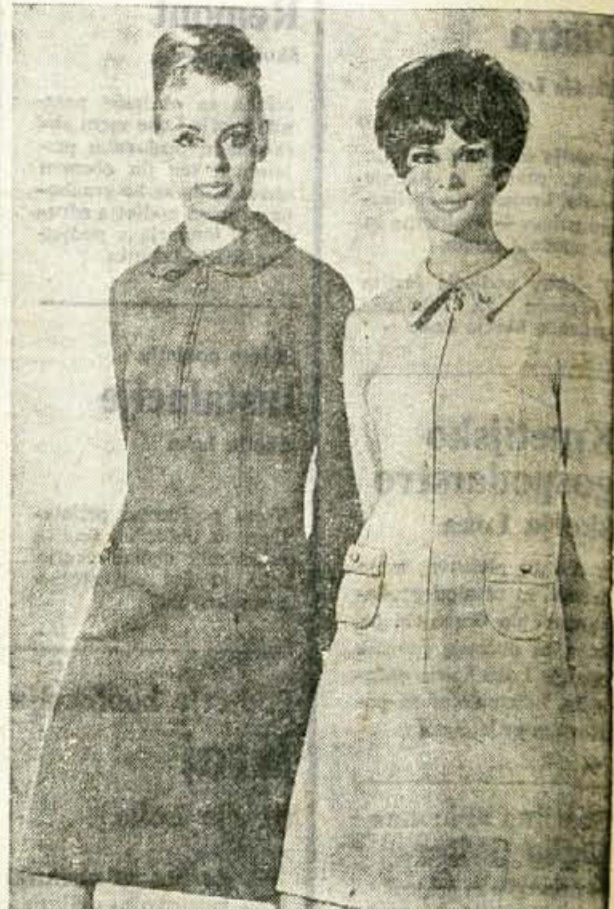
Enodelni obleki sta krojeni izrazito športno. Zadržge so letošnja modna novost

Enkrat tedensko uživajte le lahko vitaminsko hrano: zelenjavo, sadje, nemastno meso, ribe, mleko, sir, črn kruh; belega kruha tisti dan ne uživajte, prav tako ne maščob in sladkarij.