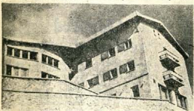
Dom na Krvavcu bo te dni zaživel. Pa ne le za letošnje praznike, za katere je spričo zanimanja domačih in tujih gostov trikrat premajhen, marveč tudi sicer, kajti nova žičnica od Gospinca do doma, ki bo začela obratovati te dni, bo dom še bolj približala mnogim turistom

Demonstracija bo v pogovoru s strokovnjaki Opreme Kranj ob gimnaziji. Vstopnine ni