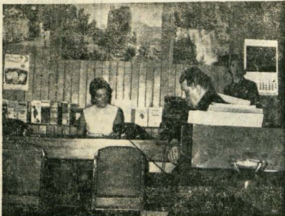
V poslovalnici Yugotoursa