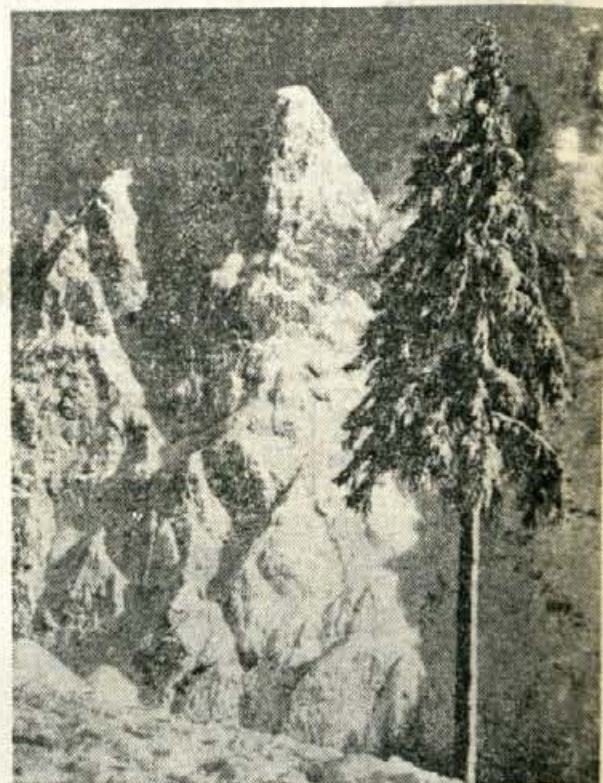
Julljci v zmlti