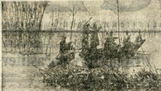
Ob zadnjih poplavah so bile enote JLA prve pripravljene priskočiti na pomoč prebivalcem