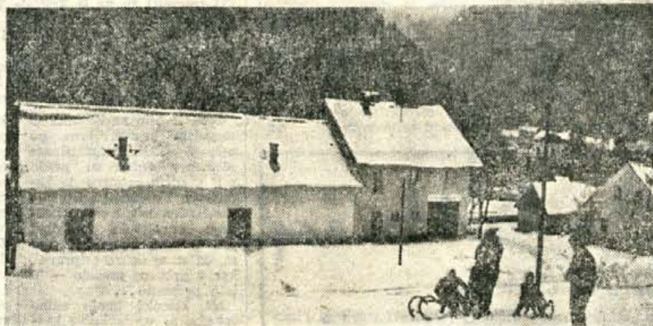
V nedeljo ob 15. uri so v Podljudelju odprli nov družbeni center. Gradili so ga v glavnem vaščani sami, začeli pa so z občinskim posojilom za gradnjo družbenih prostorov. Precej denarja so prispevale tudi tržiške delovne organizacije. V novem domu je dvorana za približno 200 ljudi, z vsemi stranskimi prostori

V kranjski občini je deset društev prijatelj mladine. V teh dneh se povsod pripravljajo na redne letne občne zборе. Na njih največ razpravljajo o vzgoji in varstvu otok, skrbi za socialno ogrožene in vzgojno zanemarjene otroke, letovanjih zanje ter o pripravah na novoletno jelko. Na vseh občnih zborih imajo tudi predavanja iz šole za starše. S postavitvijo novih šol v Cerkljah in Preddvoru pa si v obeh krajih trenutno najbolj prizadevajo, da bi uredili otroški vrtec. O podobnih vprašanjih razpravljali tudi na občnem zboru Kranj-Center, ki bo v petek prihodnji teden. A. Z.