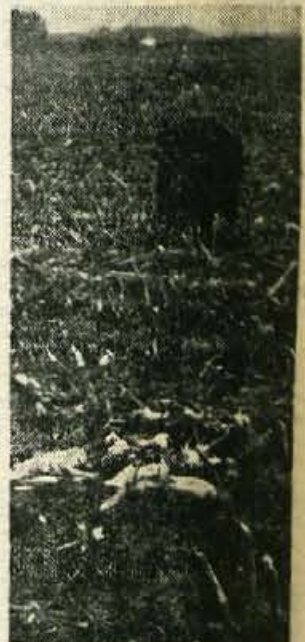
Tudi koruzo so slabo pobrali. Malomarnost so izkoristili »privatniki« s cekarji

Po pripovedi inženirja Stareta sem videl, da pri krom-