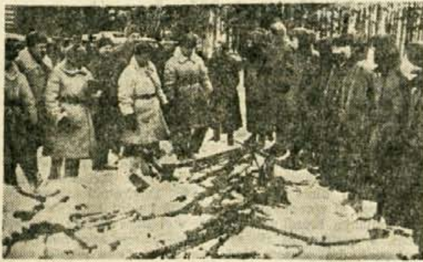
Del razbite nemške armade izroča orožje

Spominjam se poročila poveljnika armade generala Mihajla Fjodoroviča Lukina, ki je bil s svojo enoto prav tako obkoljen: »Vojaki so se borili do zadnjega diha in do zadnjega naboja.« On sam je bil v teh bojih ranjen v nogo in roko, ki so mu jih pozneje morali odrezati. Ranjenega so Nemci ujeli. Junaštvo M. F. Lukina v bojih v času obkoljevanja in njegovo zadržanje v ujetništvu zasluži najvišjo oceno. Poglejmo še eno njegovo poročilo iz tega obdobja: »19. armada v času nemškega udara od 2. do 13. oktobra ni bila razbita. V teh težkih dneh je ohranila svojo enotnost kot armada, ne da bi zgubila zvezo s svojimi enotami niti s fronto.« Tako so enote na področju Vjazme zadržale napad sovražnika. To je omogočilo skoncentrirati nove sile na Možajski črti in zaustaviti prodor nasprotnika k našemu glavnemu mestu.