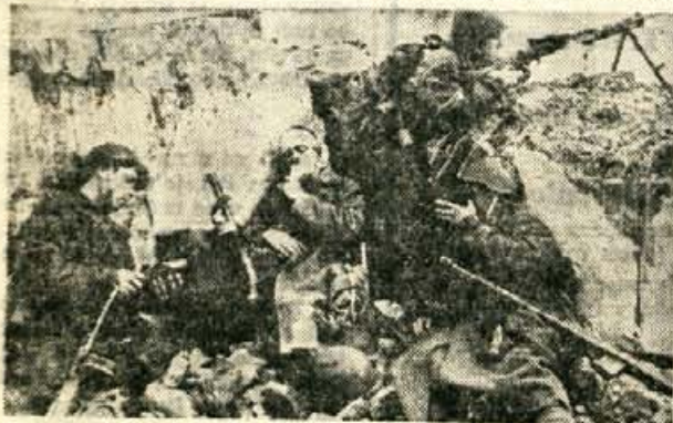
Trenutek zatíjšja na fronti