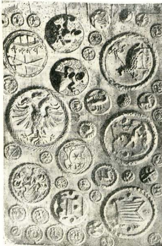
Z RAZSTAVE O MALEM KRUHKU — Baročni model za pečivo visokih družbenih slojev; upodobljeni so heraldični motivi plemiških rodbin, ki so imele na Slovenskem svoja posestva — Foto Perdan