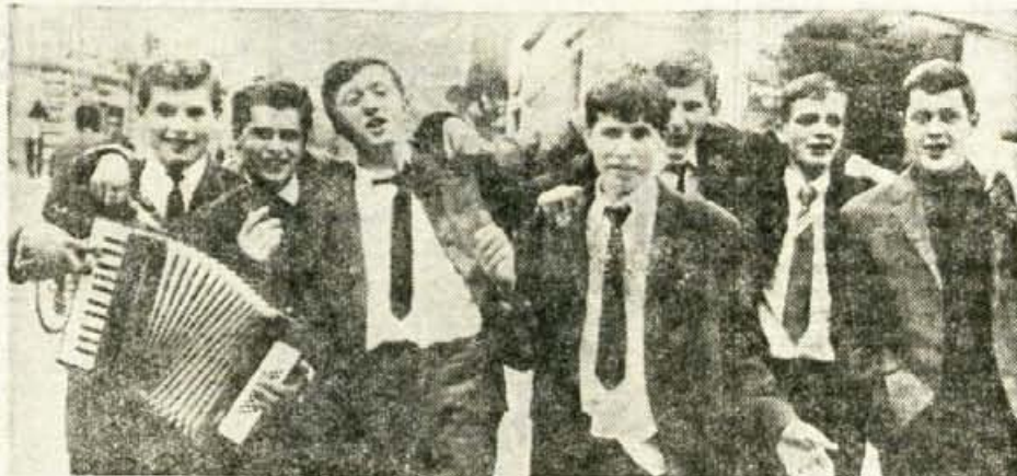
Pred odhodom k vojakom sta za mlade fante dve posebni priložnosti za veselo razpoloženje. Prva je nabor, druga pa odhod na odsluženje kadrovskega roka, o čemer smo že pisali. Na sliki: gruča fantov veselo vriska po kranjskih ulicah, ker je »potrjena«

V primerjavi z junijem so se do konca septembra cene na drobno povprečno povečale za 1,04 odstotka. Povečale so se predvsem cene tistih proizvodov, za katere ni več potrebno soglasje zveznega zavoda za cene. Od 55 proizvodov te vrste, se jih je v razdobju junij — september podražilo 24 ali nekaj manj kot polovica. Predvsem so se podražili gumijski proizvodi.