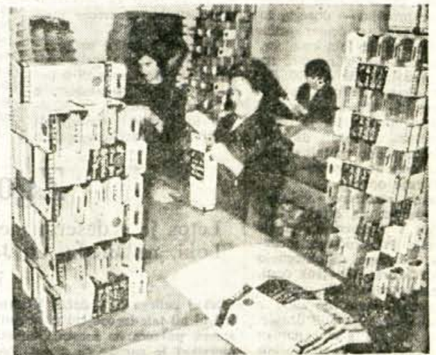
V kartonažnem oddelku podjetja »Invalid«

in to še bolj, če vemo, da je znašala vrednost proizvodnje leta 1959 9 milijonov dinarjev, pri tem pa so imeli 600.000 dinarjev izgube. Tudi osebni dohodki so se jim v zadnjem letu precej dvignili. Od povprečje 47.202 v lanskem letu so letos prišli na 71.000 starih dinarjev.