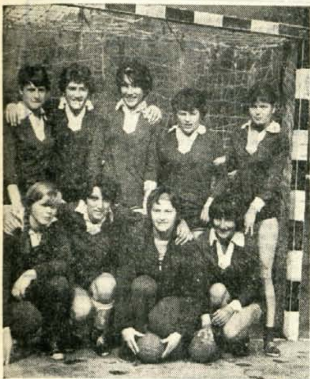
Rokometnice iz Selca so se letos povsem nepričakovano vmešale celo v borbo za naslov slovenskih prvakinj