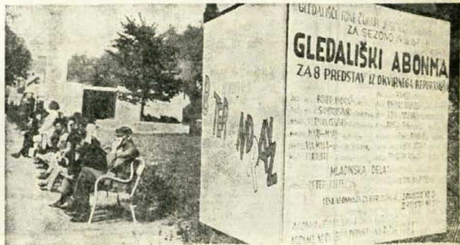
Pred začetkom letošnje sezone v gledališču Toneta Cufarja na Jesenicah so razpisali tudi vrsto abonmajev. Lepaki z razpisi so bili na vidnih mestih povsod na Jesenicah. Kaže, da bo gledališka sezona 1966/67 na Jesenicah plodna

Predavanje bo v četrtek, 27. oktobra, ob 17. uri v Stebriščni dvorani Gorenjskega muzeja (vhod s Poštne ulice).