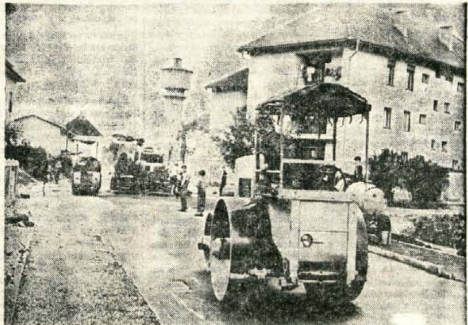
V četrtek so na cesti Kokrškega odreda pri Vodovodnem stolpu v Kranju končali z deli. Cesta je dolga okrog šeststo metrov in široka pet do šest metrov. Pri asfaltiranju so porabili okrog sedemsto ton asfaltne mase, kar stane okrog šestnajst milijonov starih dinarjev