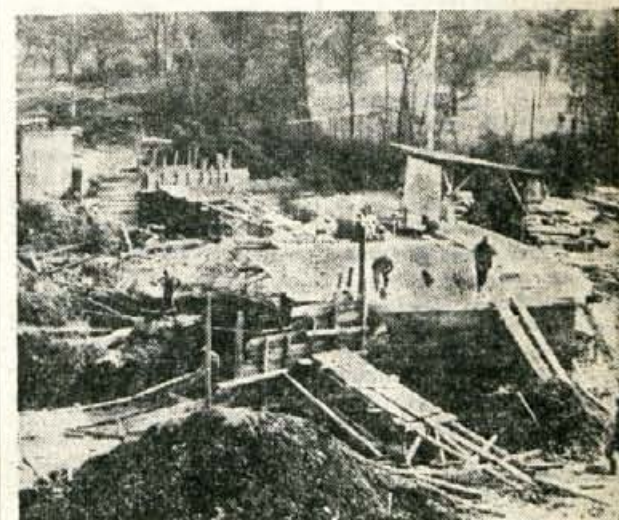
MOST ZA TERMIKO — SGP »Tehnik« iz Škofje Loke je pričelo delati 25. avgusta nov most čez Soro v Zmlincu. Most financira tovarna »Termika« in bo stal okoli 50 milijonov starih dinarjev. V to vsoto so všeta tuji druga dela, in sicer prelivni objekt, most in nasipi. Stari most je bil ob zadnji povodnji močno poškodovan in bi ga lahko vsaka večja voda odnesla.