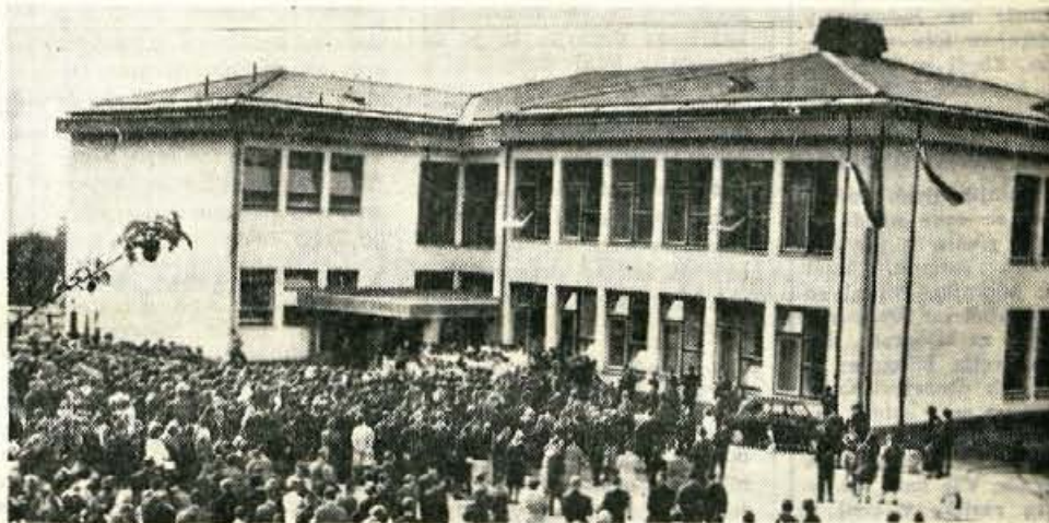
Nedelja, 16. oktobra 1966 ob 10. uri — V Preddvoru so odprli osnovno šolo Matije Valjavca