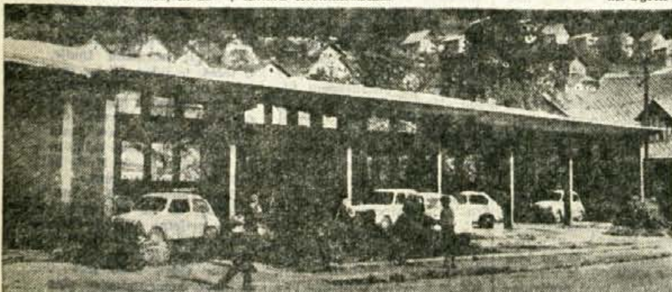
Ze res, da so pred letom »zamrzile investicije«, toda to ne bi smel biti vzrok, da stavbe, ki niso dokončane, zaradi pomanjkanja sredstev prepustimo kar propadu. Tako »zamrzne« stavbo si lahko ogledate na Jesenicah za kinom »Radio«. Jeseničani so jo izkoristili kar za garažo.

Ne bi hoteli ocenjevati dejstev, ki jih je navajal predsednik notranjega samoupravnega organa zavoda. Drži pa, da odnosi v zavodu zaradi mnogih objektivnih in osebnih razlogov, ki so zunaj in znotraj te ustanove niso najboljši. To pove med drugim tudi odnos predsednika skupščine komunalnega zavoda za socialno zavarovanje na skupščini, ko sprva sploh ni hotel dopustiti, da bi predstavnik zavoda povedal svoje mnenje.