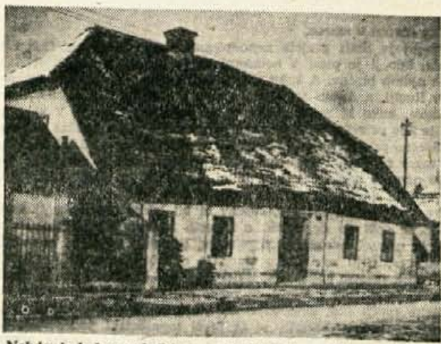
Nekdanja krčma pri »Pému«, sedaj Tržaška c. 52

Bil pa je naš Prešeren gotovo samozavesten mož, kajti zavedal se je svojega pesniškega poslanstva in veljave. Wohlmuthova nam sporoča o tem: »Večkrat je rekel: tristo let bo moje ime trajalo dalje, kakor štathal-