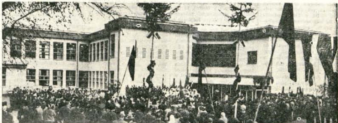
Sobota, 15. oktobra 1966 ob 16. uri — V Cerkljah so odprli osnovno šolo Davorina Jenka