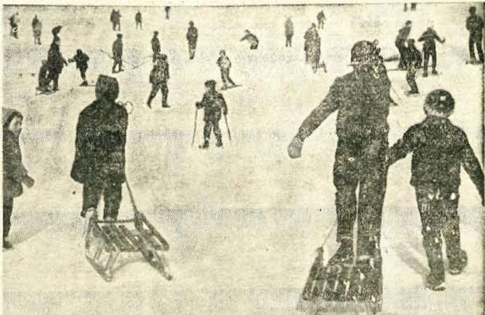
Smučišča in sanklišča so spet oživala. Zimske počitnice so in otroci imajo čas, da se sprostitjo in naberejo novih moči za drugo polovico leta. Nekateri smučarski klubi so ob tej priložnosti pripravili več smučarskih tečajev. S tem so vsekakor opravili koristno delo

Za delovne organizacije, ki tega ne bodo storile do določenega roka, so predvidene tudi sankcije. Zato se bodo prav gotovo sedaj začeli pojavljati razni vzorci in spet bo prišlo do prepisovanja, ki bodo morda trenutno zadostila predpisom, ki pa v svojem bistvu lahko povzročijo med kolektivi samo zmedo in nezadovoljstvo. A tega bi se bilo treba izogibati. K. M.