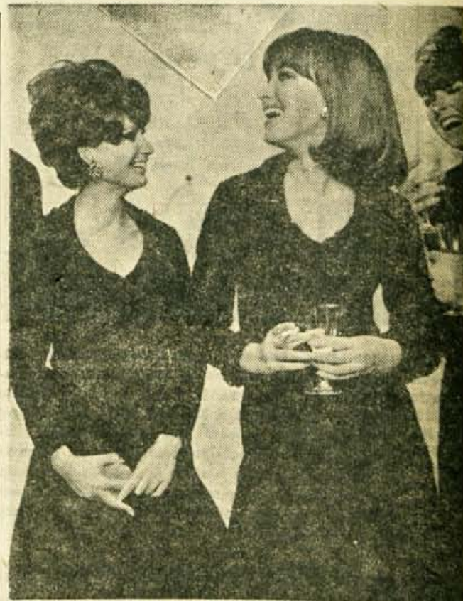
Ali boste obiskali plesno prireditev? V temni obleki boste prav gotovo elegantni. Če bo ovrtnik iz svilenih naborkov ali obleka pošita z lesketajočimi kamenčki, boste prav gotovo imeli obleko v stilu