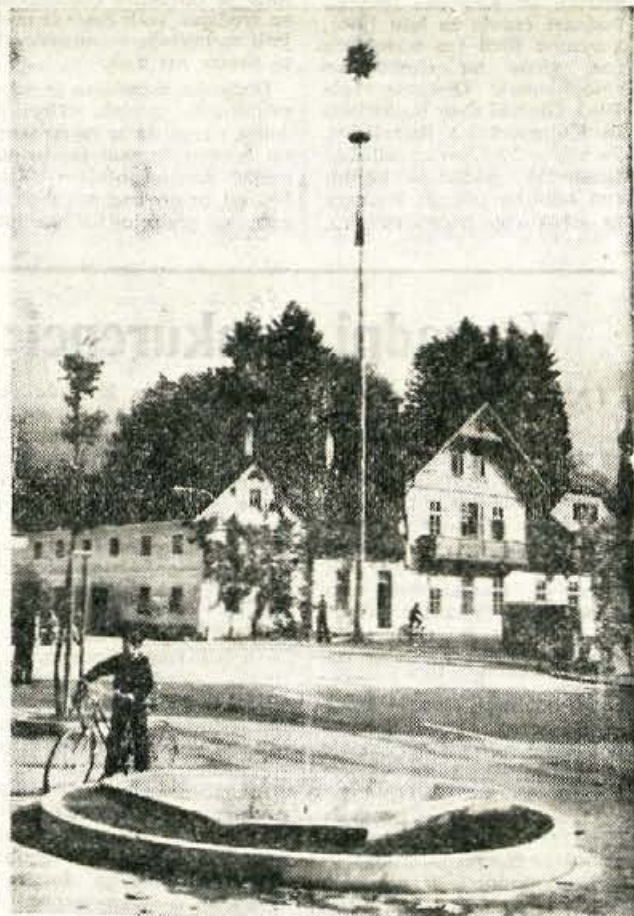
Cerklje se vneto pripravljajo na otvoritev nove šole. Mlaji po vasi in mrzlično pospravljane naj bi dali vasi svečanejši videz. Ob tem so Cerklje tudi prometno uredili. Označili so prehode za pešce, parkirne prostore sredi vasi itd. Sredi vasi so uredili manjši vodomet.

Jugoslovanske tovarne obutve so letos do septembra izvozile na konvertibilna tržišča za 139,6 milijonov novih dinarjev obutve ali 82% več kot lani v tem času, ko je vrednost izvoza na ta področja dosegla 76,5 milijonov novih dinarjev.