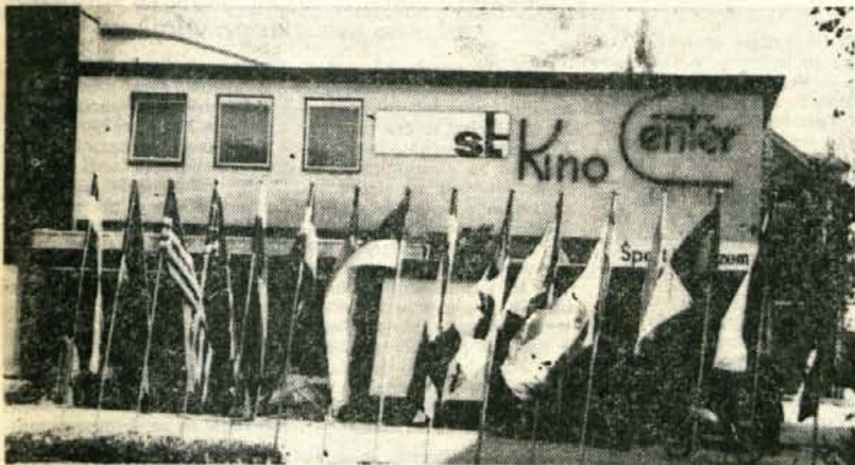
V Kranju je vse pripravljeno za otvoritev I. mednarodnega filmskega festivala »Sport in turizem«. Slovesna otvoritev bo danes, v sredo, 12. oktobra, zvečer

Danes pričetek filmskega festivala »Sport in turizem«