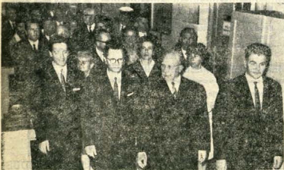
GOSTJE IZ NDR V ISKRI — Walter Ulbricht se je med ogledom Iskre večkrat pogovarjal z delavci, posebno pa se je zanimal za sodelovanje s tovarnami v Nemški demokratični republiki