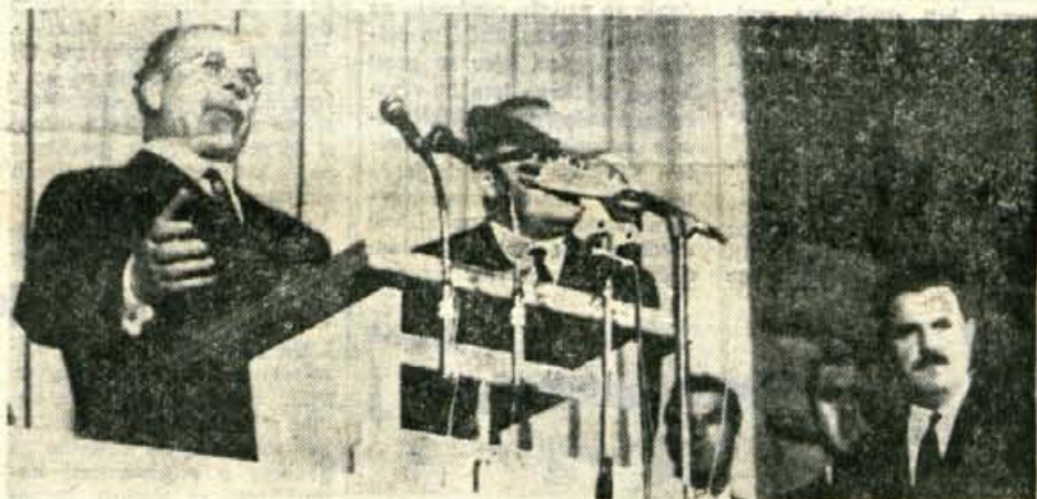
ULBRICHTOV GOVOR PRED GIMNAZIJO — Kljub dežju se je na Trgu revolucije zbralo nekaj tisoč ljudi