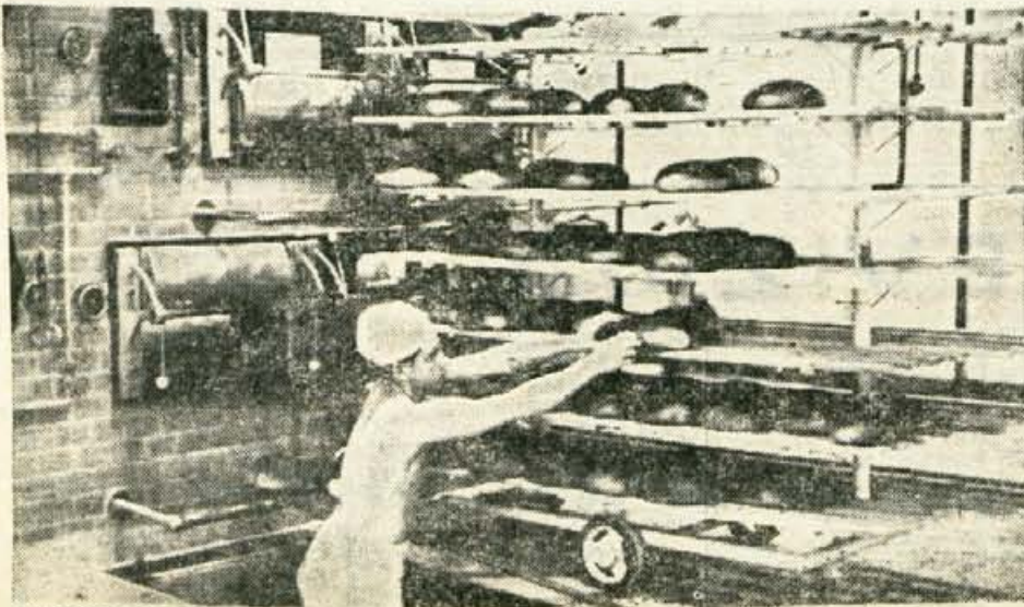
PEKARNA V SKOJJI LOKI — Pred tednom dni je pričela poizkusno obratovati nova pekarna v Skofji Loki. Čez mesec dni, ko bo zaključeno poizkusno obratovanje, bo prišel iz nove pekarnice prvi »uradni kruh«.

razmerja. Pri tem so opozorili, da je nujno, da v prihodnje o tem spregovorijo vse družbene organizacije, vključno tudi občinska skupščina, posebno pa mladina in sindikat. Za direktorja zavoda so potrdili Milana Ogriza. A. Z.