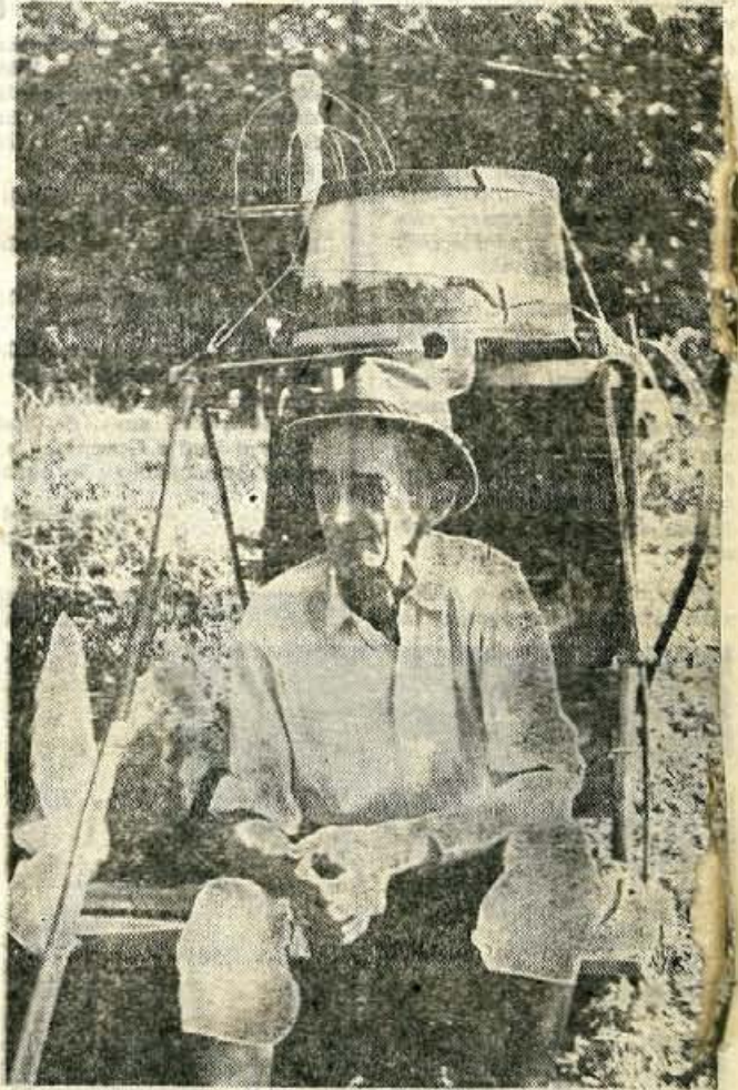
Bohinjski planšar s krošnjo, na katero naloži »basengo« — vse, kar potrebuje za življenje na planini

da se naši ljudje globoko zaveda, da je bilo za svobodo naše domovine potrebno preliti veliko krvi in prestopiti dosti gorja. J. Vidic