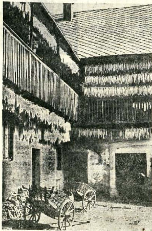
GORENJSKI JESENSKI MOTIV — Sušenje koruze v Poljanski dolini

Danes, 28. septembra, se bo v Ljubljani, v prostorih Magistrata, začel 10. kongres Mednarodne zveze za mladinsko književnost (International Board on Books for Young People), ki je sestavni del mednarodne organizacije UNESCO. Kongres bo obravnaval vrsto vprašanj, ki so pomembna za pospeševanje kvalitete mladinske književnosti, ob njegovem zaključku v soboto, 1. oktobra, pa bodo podelili sloveče Andersenove nagrade. Organizacijo 10. kongresa, ki bo tokrat prvič v socialistični državi, je prevzela ljubljanska zložba Mladinska knjiga. — a