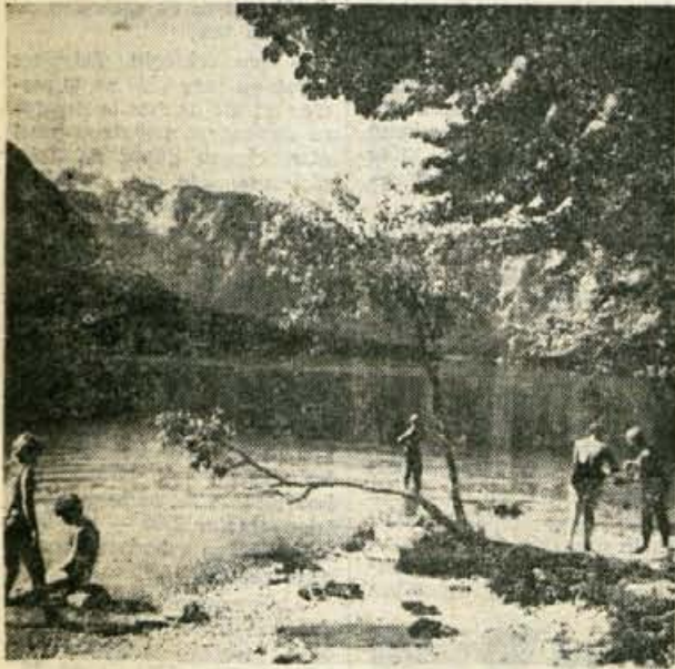
Po poletju v znamenju dežja smo na pragu jeseni, ki je v Bohinju posebno lepa in od katere letos veliko pričakujemo kar se vremena tiče. Kopalci zapuščajo blejsko in bohinjsko jezero, turisti pa še ne