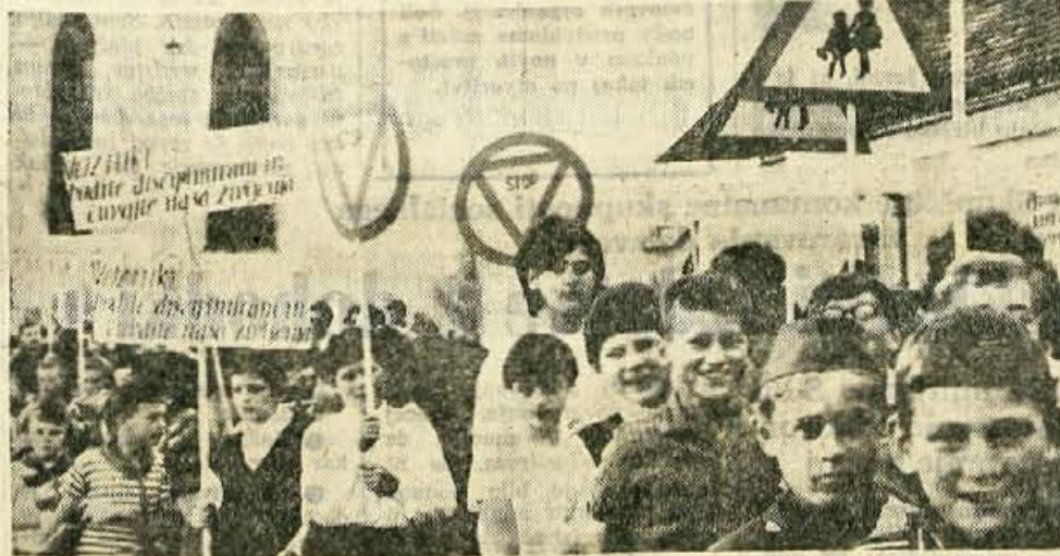
»PROMETNO VZGOJO V SOLE« je geslo zvezne prometno-vzgojne akcije, ki bo trajala od 15. septembra do 15. decembra letos. V četrtek popoldne je okrog 1500 osnovnošolskih otrok po krajskih ulicah v povorki z zastavicami in prometnimi znaki simboliziralo pričetek te akcije

Tudi v mejnem pasu prost dostop v planine