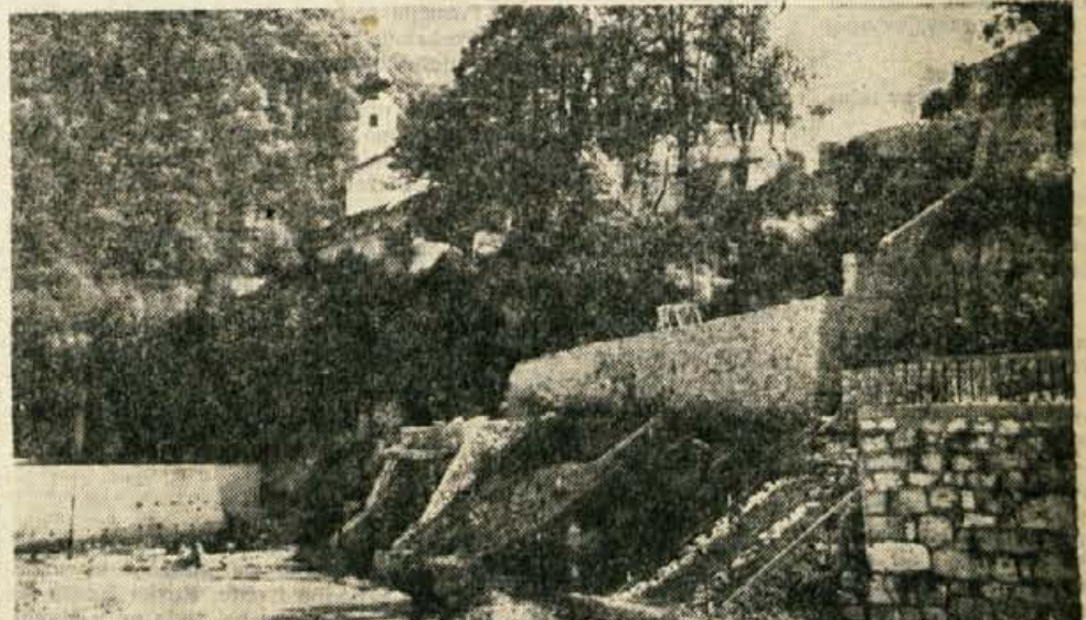
V Kamniku v zadnjih dneh urejajo Mali grad in okolico; utrjujejo in urejajo breg nad kavararno, da bo izgled lepši in da se zemlja ne bo posipala, postavili pa so tudi nekaj reflektorjev, da bo ta pomembni kulturno-zgodovinski spomenik ponovno razsvetljen. Urejen Mali grad bo v Kamniku pomembna turistična privlačnost

JESENICE: posvetovanje o financiranju izobraževanja — Na posvetovanju, ki je bilo v petek prejšnji teden in ki se ga je udeležilo več kot 50 predstavnikov šolskih zavodov, prosvetnih in družbeno-političnih organizacij, so se v živahni razpravi izluščila tri vprašanja v zvezi z osnutkom novega zakona o financiranju vzgoje in izobraževanja, in sicer: 1. Koliko sredstev za vzgojo in izobraževanje bo prinesel nov sistem financiranja? 2. Kaj vse naj bi financirali iz teh sredstev? 3. Kdo naj upravlja s tem denarjem? Ali občinske izobraževalne skupnosti ali širše regionalne izobraževalne skupnosti? Na posvetovanju je bila imenovana posebna petčlanska komisija, ki bo iz razprave izluščila zaključke in jih ponovno dala v javno razpravo. Te zaključke bo komisija poslala tudi pristojnim republiškim organom.