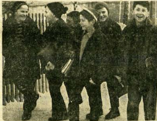
Pogovor o šolskem uspehu? Morda. Največ pogovorov med šolarji, ki so te dni nastopili semestralne počitnice, je namenjen športu in razvedrilo. Tako je prav, po delu je potreben počitek, da se lahko kasneje še resneje posvetimo učenju.