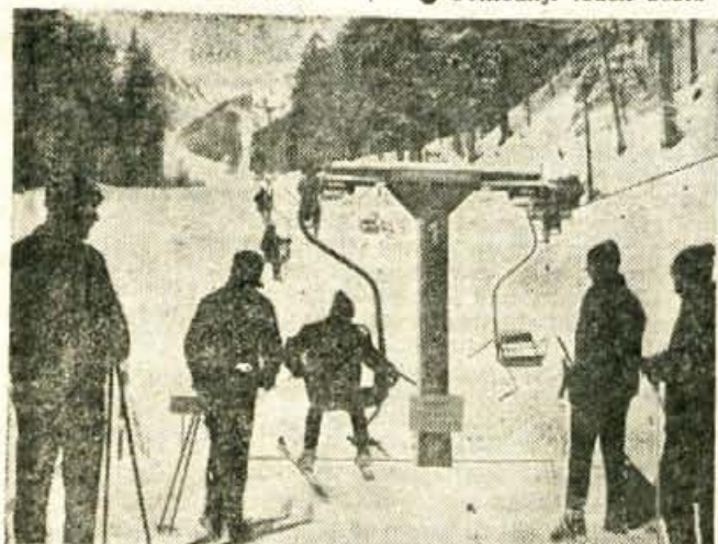
Danes ob 11. uri bodo na Zelenici slovesno izročili prometni drugi del žičnice. Žičnica sicer obratuje že od konca decembra in popelje obiskovalce na 1544 m nadmorske višine

Stari ljudje pripovedujejo, da je led takrat dovolj trden, ko gre enkrat lisica po njem. »Če je šla po ledu lisica, potem gre brez skrbi lahko tudi človek. Lisičji sledovi na ledu so zanesljivo merilo njegove trdnosti.«