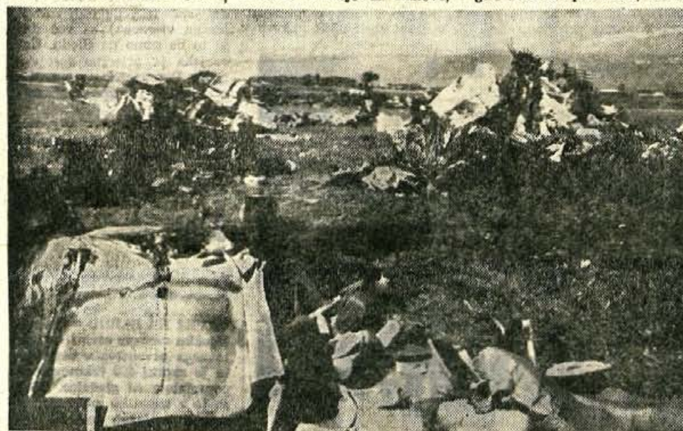
Glavne dele ponesrečenega letala Britannia, ki je v četrtek prejšnji teden strmoglavilo pri Lahovčah, so reševalne ekipe znosile na travnik pred gozdom. »Firbcevi« je še vedno dovolj