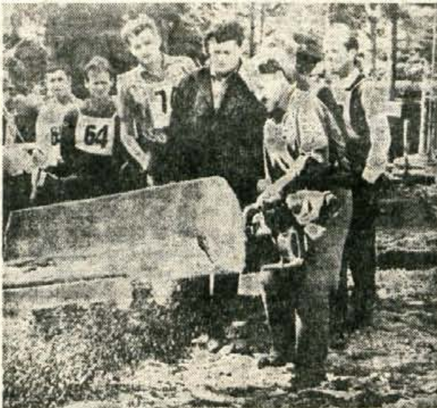
Prizor s tekmovanja

Na stroške kolektiva si bo v mesecu septembru skupina najbolj uspešnih iznajditeljev ogledala Zagrebški velesejem. Razstavljeni tehnični dosežki bodo tem ljudem brez dvoma pomagali pri izboljšavah na lastnem delovnem mestu.