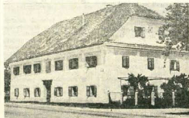
Stara mogočna hiša na Laborah, v kateri je bila včasih gostilna, bo kmalu spet služila svojemu nekdanjemu namenu. Lastnik je namreč spet uredil gostilno ob strokovni pomoči Zavoda za spomeniško varstvo Kranj

Te dni je Delavska zveza Jesenice objavila program dela za odrasle. Program bodo z vpisom v večeršolsko ekonomsko šolo in v strokovni grafski ter daktilografski tečaj. V načrtu imajo tudi tečaj tujih jezikov, ki jih bodo organizirali predvsem gostinske delavce.