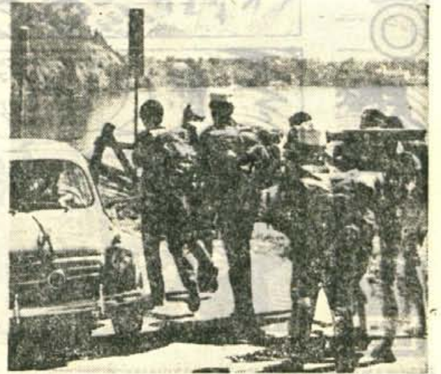
»Nemotorizirani turisti na Bledu

Planinci, plezalci in alpinisti iz Kranja niso hoteli za-