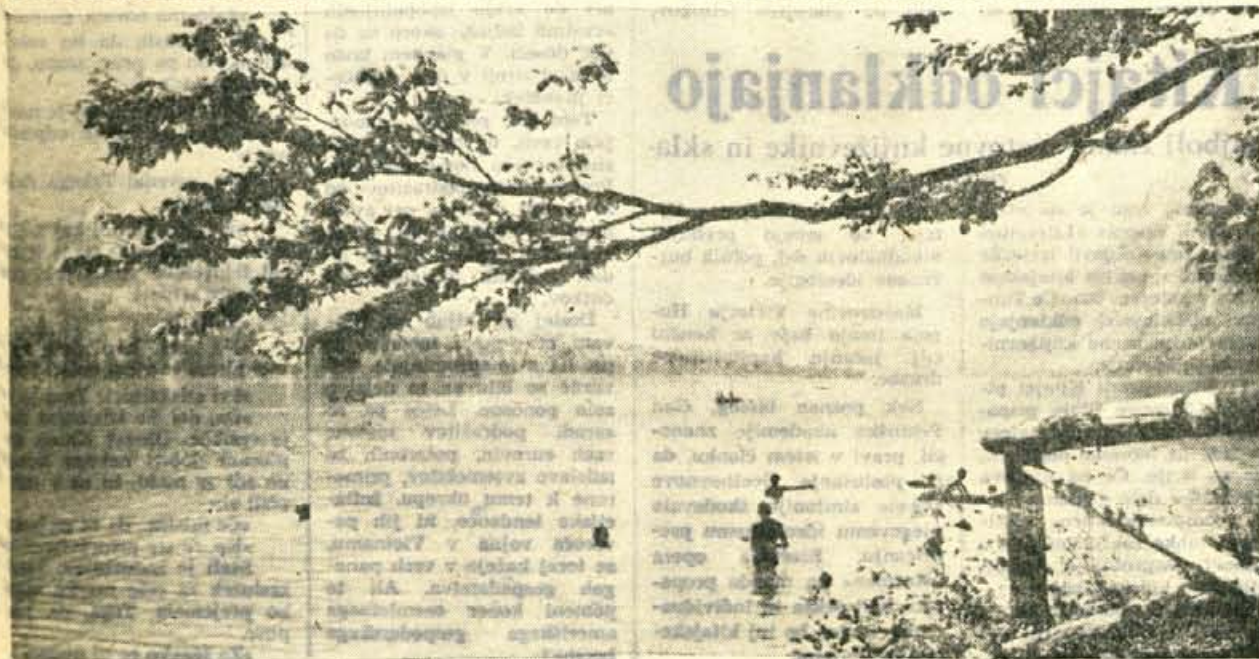
Pozno poletna idila.

Vsa gorska zavetišča, ki so jih zgradili plezalci, alpinisti in gorski reševalci, odlično služijo namenu in zgovorno pričajo o izrednem delovnem poletu naših mladih, perspektivnih in veliko obetajočih plezalcev in alpinistov, ki pogumno in prizadevno in istočasno tudi uspešno segajo po lovornikah svetovnega alpinizma v Alpah, Dolomiti, Kavkazu, Hindukušu, Himalaji in Andih, kjer kipe in se poganjajo proti nebu najtežje dosegljivi vrhovi.