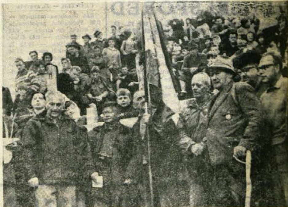
Z otvoritvene slovesnosti nove Prešernove kočice na Stolu