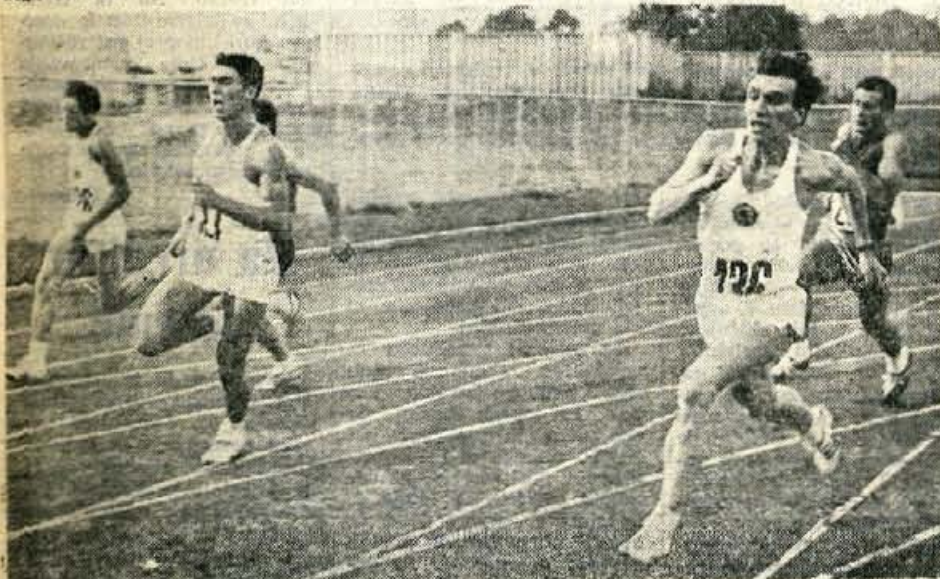
ATLETIKA IN POPULARNOST — V soboto in nedeljo je bil na stadionu »Stanka Mlakarja« v Kranju mladinski atletski dvoboj Jugoslavija : Bolgarija. Stevilni gledalci so potrdili, da je v Kranju precejšnje zanimanje za atletiko. Na sliki — tek na 200 metrov. Več o tekmovalstvu na 9. strani