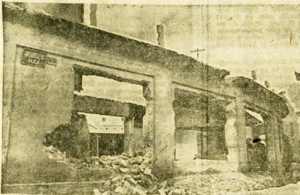
V Kranju so pričeli rušiti pritrilčne stavbe za »Staro pošto«. Na tem mestu je v načrtu gradnja trgovskega centra. V prvi fazi del bodo porušili le nekaj stavb ter na praznem prostoru začasno uredili parkirni prostor. Računajo, da bodo pričeli z gradnjo trgovskega centra približno čez dve leti