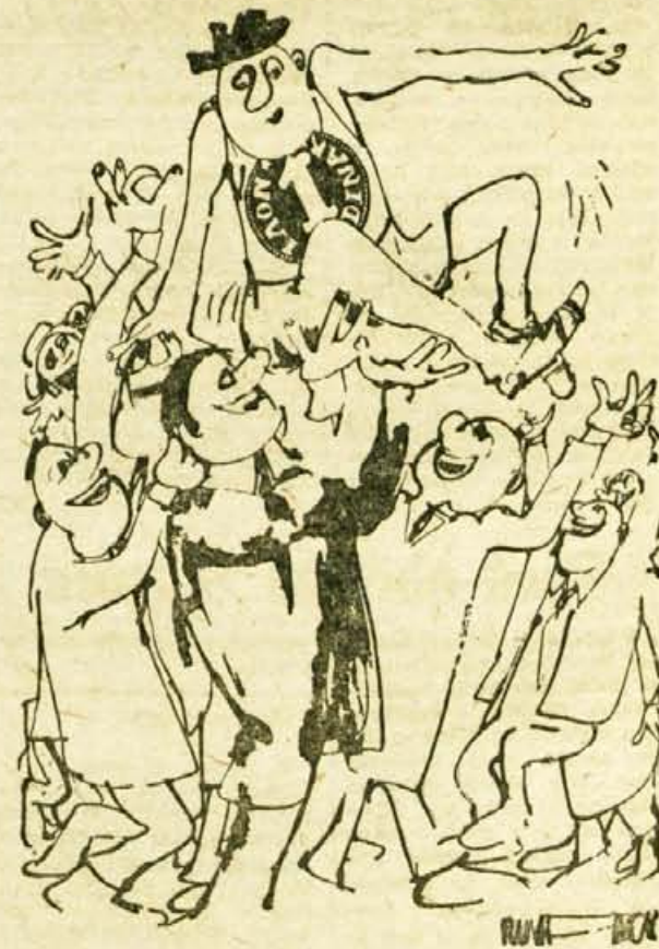
NA TEMO: NOVI DINAR — Samo pazite, da me ne spustite!