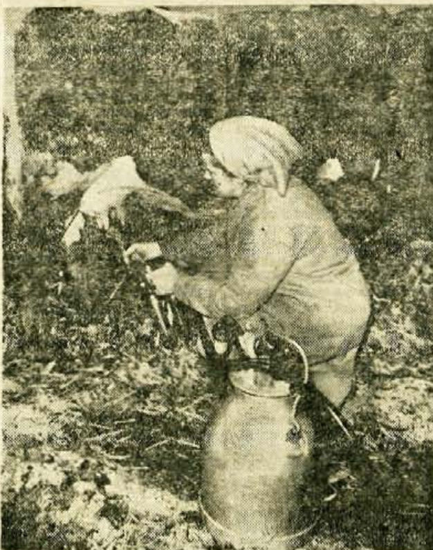
Molznega stroja so se pri Cernetu v Podbrezjah že tako privadili, da brez njega ne bi več mogli

Podnebni in tržni pogoji v nakeljski zadrugi narekujejo tri specializirane proizvodne smeri: živinorejo, krompir in zelenjavo.